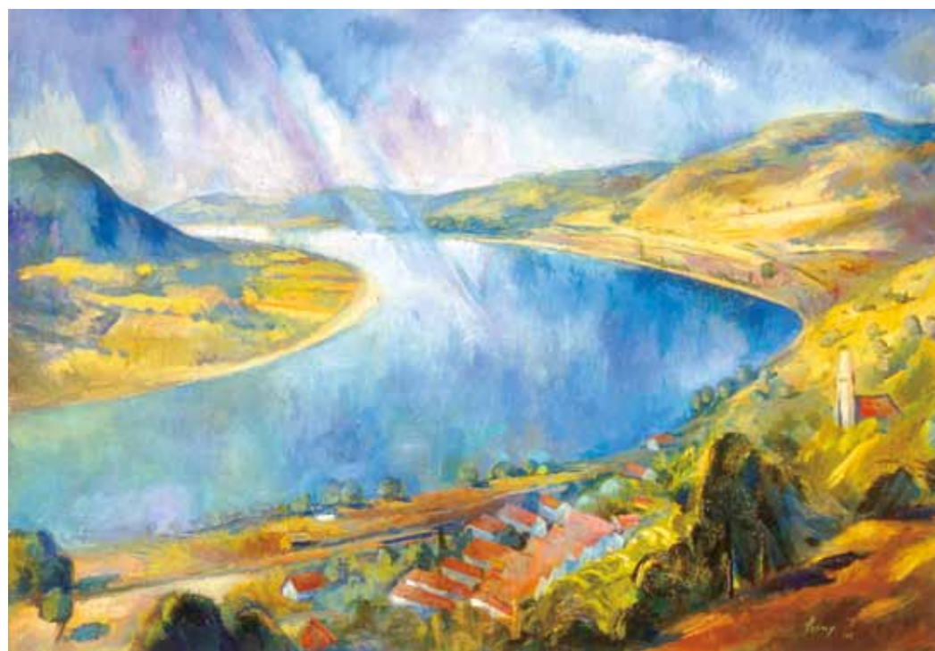
5. Szőnyi István: Zebegény, 1923 magántulajdon