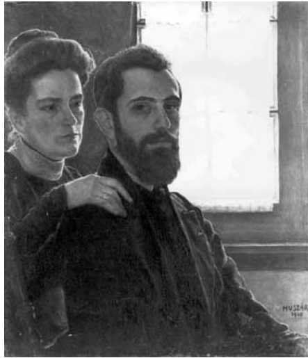
Huszár Vilmos: Önarckép feleségével, 1910 Haags Gemeentemuseum, Hága