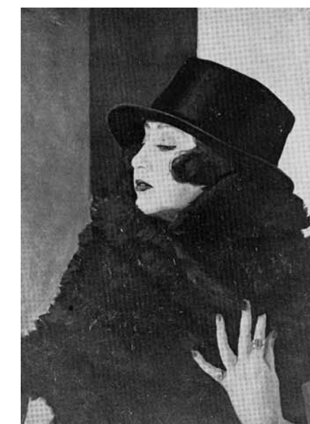
Huszár Vilmos: Női portré, 1925 körül, Magántulajdon