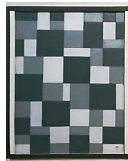
Huszár Vilmos: Szürke kompozíció, 1918 Magántulajdon