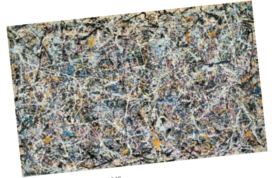
3. Jackson Pollock: No. 1., 1949, Rita and Taft Schreiber Gyűjtemény, The Museum of Contemporary Art, Los Angeles