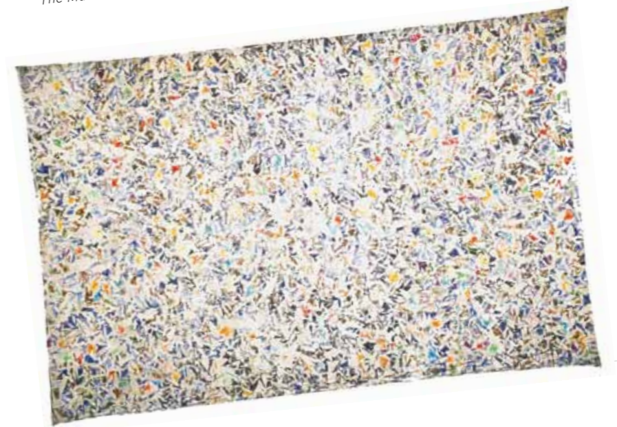
4. Hantai Simon: Cim nélkül, 1973, Ludwig Múzeum, Budapest