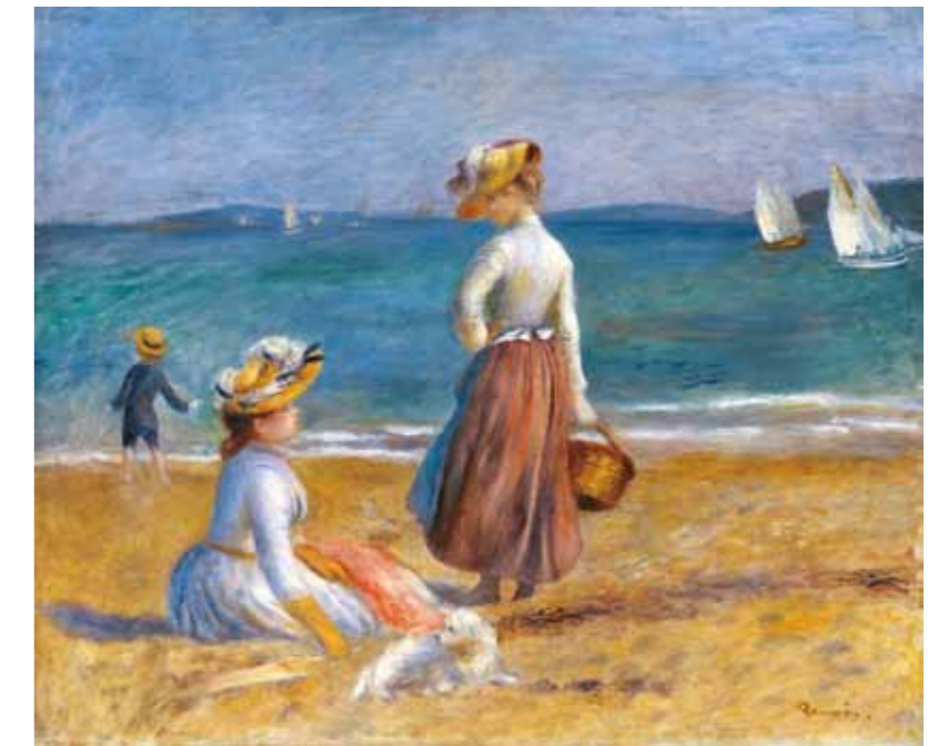
9. August Renoir: Tengerparton, 1890 Metropolitain Múzeum, New York