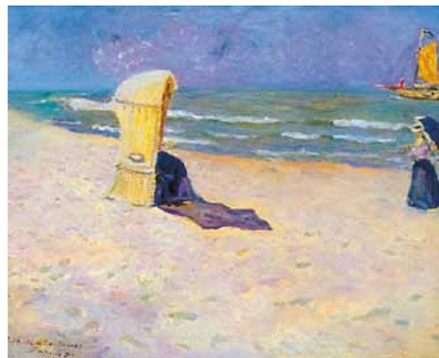
3. Perlmutter Izsák: Belga tengerpart magántulajdon