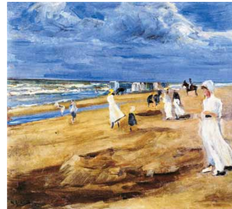
8. Max Liebermann: Tengerpart, 1908 magántulajdon