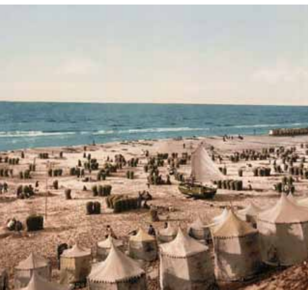
4. Tengerpart Hollandiában, 1890