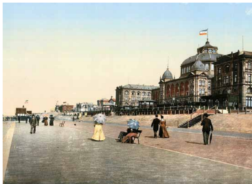
5. Holland tengerpart, 1890