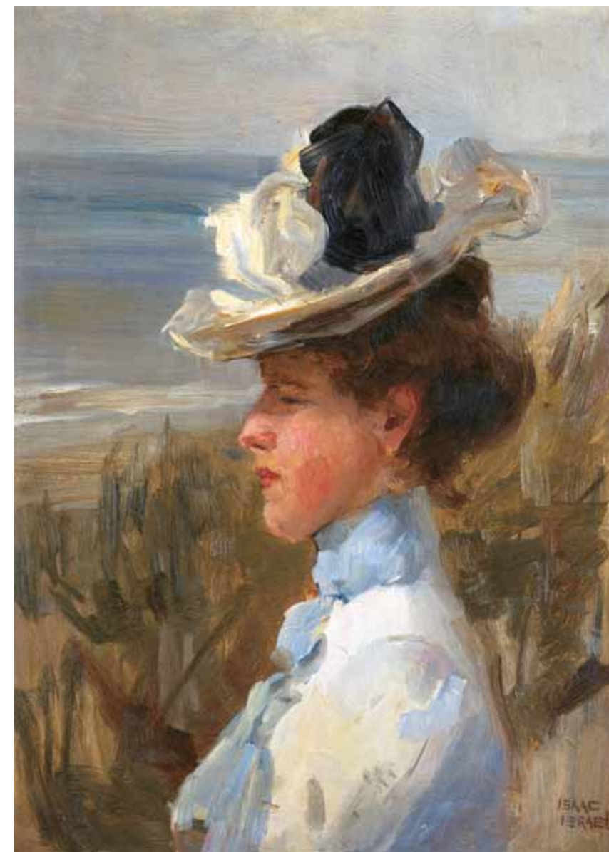
6. Isaac Israëls: Tengerparton, 1900 körül Gemeentemuseum, Hága

már terjedő modernizmus sürgető újat akarása; a kor festészete még ezer szállal kötődött Rembrandt, Vermeer van Delft, vagy éppen Frans Hals tradicionális festői gyakorlatához. A Tengerparton című kép legközelebbi rokona a Kövesi-gyűjteményben található, 1904-ben festett szintén tengerpartot ábrázoló festmény, és annak egy másik, Lázár Béla által reprodukált verziója, amelyen szintén szélfogó strandkosarakban üldögélő hölgyeket látunk a homokos tengerparton. A viselet és a hangulat alapján mindhárom kép vélhetően Hollandiában készült, ahol Perlmutter évekig élt. Perlmutter Párizsból először az Amszterdam melletti kisvárosba,