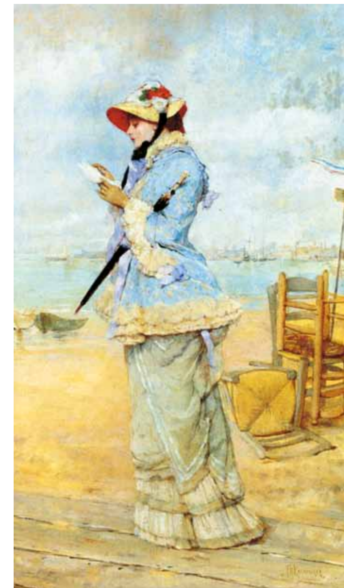
7. Frederich Hendrick Kaemmerer: Hölgy a tengerparton, 1900 körül magántulajdon

Larenbe, majd onnan egy másik kisvárosba, Volendamba költözött. Hollandiai élete 1904-ben ért véget, amikor hazatelepült Budapestre, de a nyarakat leginkább a Szolnoki művésztelepen töltötte. Az igen jómódú, nagypolgári családból származó Perlmutter 1908-ban vásárolta meg a rákospalotai Vécsey-kúriát, majd az 1900-as évek vége hozta meg számára az első nagy sikereket is: a Vasárnapi látogatás című képe Münchenben aranyérmert nyert. Ez a kép jó példa arra, hogy az impresszionista és posztimpresszionista kísérletezés után Perlmutter megtért a magyar népi életkép Fényes Adolffal fémjelzett „szolnoki” hagyományához.