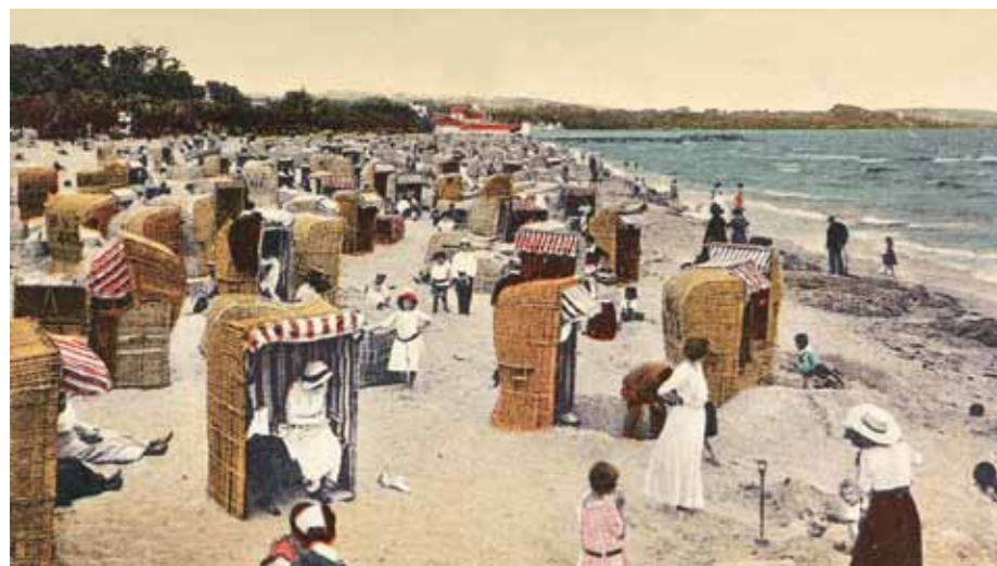
2. Tengerpart Hollandiában, képeslap, 1900-as évek eleje