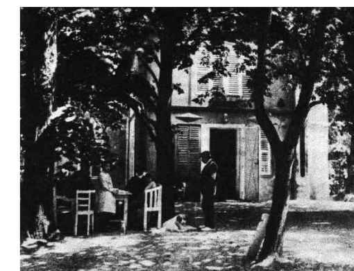
1. A kaposvári Róna-villa egykor és most

† Rippl-Rónai József kaposvári gyűjteményes képműkiállítása, 1905. december 17. – 1906. január 2. (katalógus: 163. Karácsonyfa díszítés) † Rippl-Rónai József gyűjteményes képműkiállítása, Könyves Kálmán Szalon, Budapest, 1906. február (katalógus: 106. Karácsonyfa díszítés)