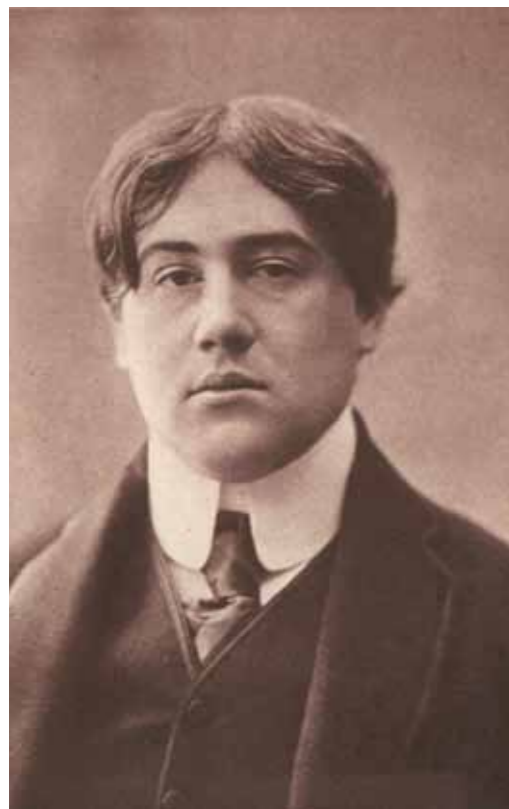
3. Molnár Ferenc