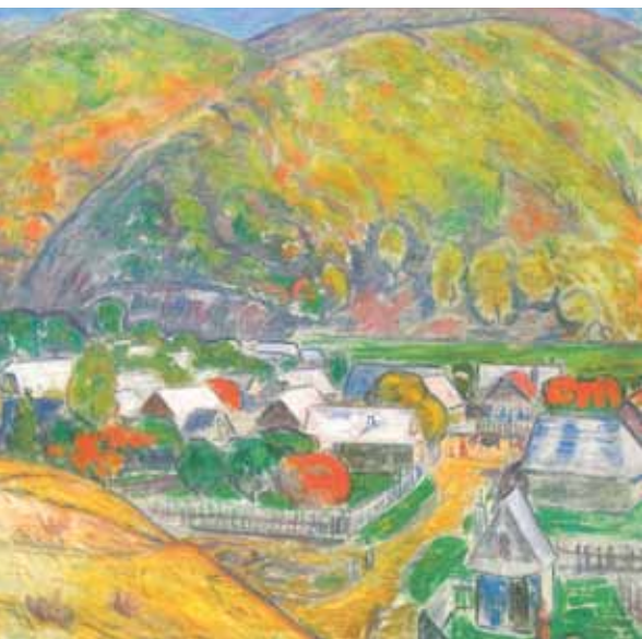
Iványi-Grünwald Béla: Nagybányai táj, 1908. magántulajdon