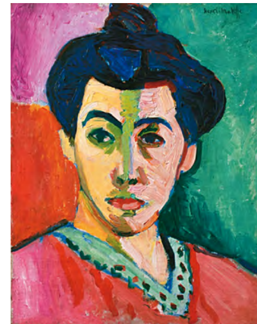
1. Henri Matisse: A zöld vonal, 1905 Dán Nemzeti Galéria, Koppenhága