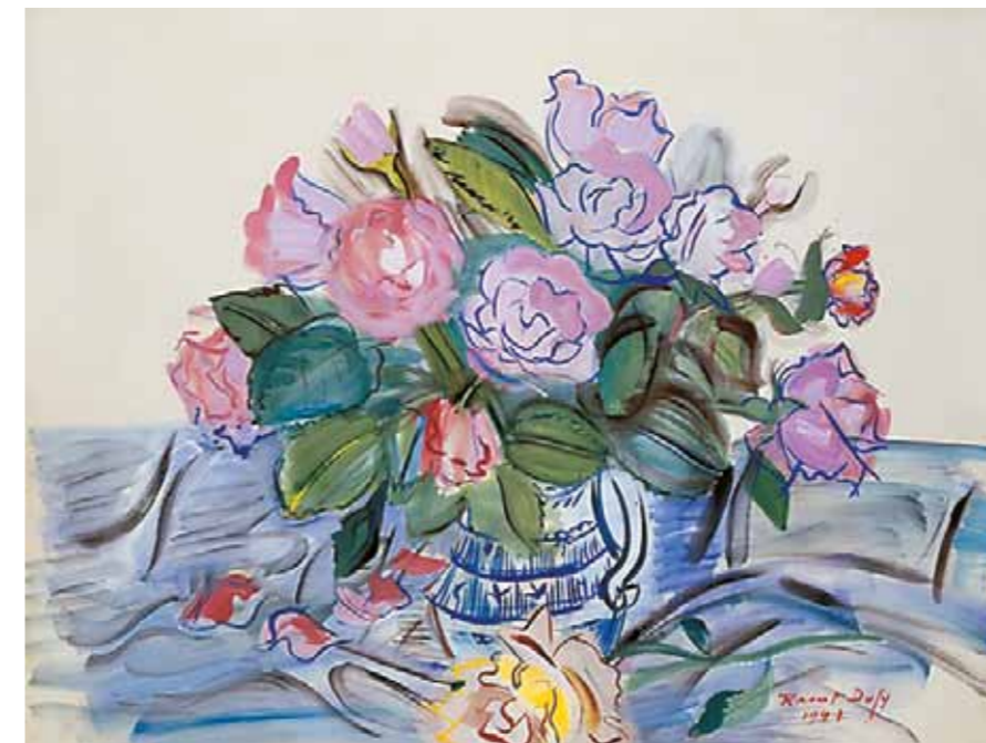
1. Raoul Dufy: Rózsák kék vázában, 1941 The Metropolitan Museum of Art, New York