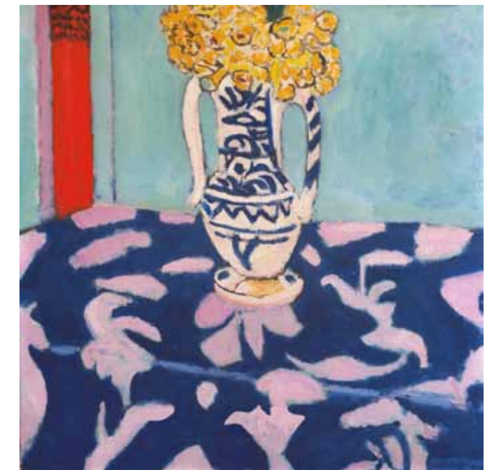
2. Henry Matisse: Kakukk madarak, kék-rózsaszín szőttes, 1911 magántulajdon

Kortársai aligha értették festészetét. A korabeli, gyakran elmarasztaló szavaknak mára minden tartalma elkopott. Ma már látjuk, hogy bármibe fogott, eljutott a csúcra , lett legyen ez a szó legszorosabb értelmében vett naturalizmus, szimbolizmus, realizmus, avantgárd mozgástanulmányok sorozata, expresszionizmus, a fehér képek korszaka, az art deco. A régiek közül Rubenst juttatja az avatott néző eszébe, az újak