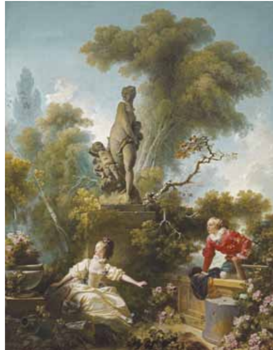
5. Jean-Honoré Fragonard: A fogócska (A szerelem útja), 1771–1773 Frick Collection, New York

A Rokokó című kompozíció Szinyei Merse Pál életművének egyik „vándormotívumaként” többszörös megszakítással és újramezsel tarkított alkotói korszakának összes szakaszához kötődik. Első színvázlatát még müncheni tanulmányai alatt, a Majális évében (1872) festette, azonban kidolgozására jernyei visszavonulásának idején nem került sor. A nagyobb méretű, részletesebb kép megfestését 1882-ben kezdte meg Bécsben, az utolsó simításokat pedig csak egy évtizeddel később, 1894-ben végezte el, mikor Zemplényi Tivadar „felrázta [alkotói] resignációjából”. 2