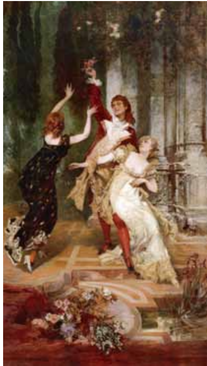
4. Hans Makart: Sub rosa, 1882 Salzburg Museum