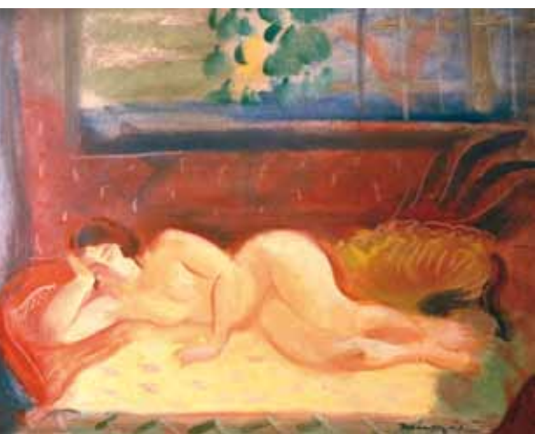
Márffy Ödön: Akt pamlagon, 1930 körül Miskolci Képtár

Két nagyobb időszak különíthető el Márffy életművében, amelyre különösen jellemző az akt. Az első a Nyergesújfalun való fauve-os kibontakozás időszaka, midőn Kernstok Károly által szerzett modelleket volt módja festeni. Ez a periódus a Nyolcak időszakára is átvitt, ekkor sok aktos kompozíció, Árkádia jelenet került ki ecsetje alól. Aktfestészetének második nagy szakasza a húszas évekre tehető, amikor a legfőbb modellje fiatal felesége lett. Ám nem Csinszka volt az egyetlen fiatalasszony, akit meztelenül is megfestett. A húszas évek második felében tűnik fel vásznain egy bronzbarna, félhosszú hajú nő, aki nemcsak a hajviseletében különbözik feleségétől, de testalkatában is. A filigrán Csinszkánál masszívabb, főként vállban erősebb csontozatú modell kiletéről a Márffy által festett képeken kívül pillanatnyilag semmilyen más forrás nem áll rendelkezésünkre. Elképzelhető, hogy a tágabb családhoz tartozott, mivel nem ismerünk olyan megnyilatkozást Csinszkatól, amely féltékenykedésre utalna, szemben Ticharich Zdenkára tett megjegyzéseivel, akiben vetélytársnőt látott.