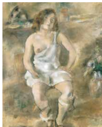
Jules Pascin: Ülő modell, 1925 magántulajdon

Márfy ezekben az években hasonló művészi utat jár be, mint számos valamikori fauve társa (Matisse, Dufy, Manguin) illetve az École de Paris alkotói közül Kisling vagy Pascin – azaz, mind inkább dekoratív, könnyeden érzéki irányban fejleszti tovább a korábbi vad majd konstruktív stílusát. A fésülködő vagy pamlagon heverő változatok mellett, ezt a szabadban ülő kompozíciót is átlengi a frivol vágyakozás hangulata, anélkül, hogy az erotikus jelleg túlzottan tolazkodó lenne, mint például Pascin képeinél. A gömbölyded formák hangsúlyozása, valamint a testtartás, különösen a várakozóan félrebiccentett fej, azonban hívogató jelleget kölcsönöz a póznak. A könnyed ecsetkezelés, a csak a lényegre koncentráció, a környezet jelzésszerű, nagyvonalú megfestése, a dekorativitásra való törekvés Márfy-t úgy sorolja be az École de Paris stílusába, hogy ezekben az években nem is időzött Párizsban.