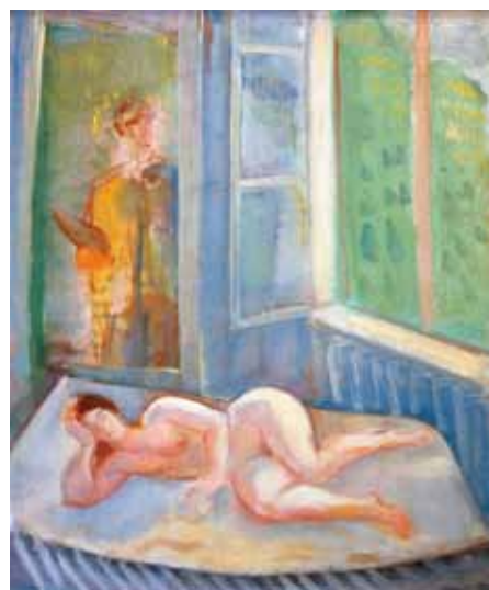
Márffy Ödön: Festő és modellje magántulajdon