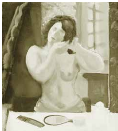
Márfy Ödön: Fésülködő nő, 1929 magántulajdon