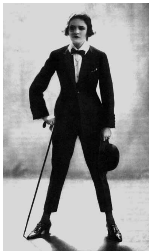
1. Anita Berber