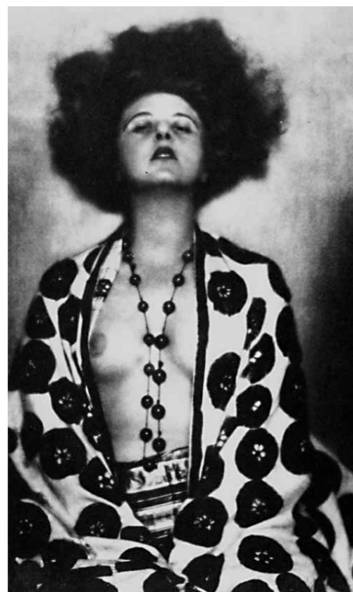
2. Anita Berber