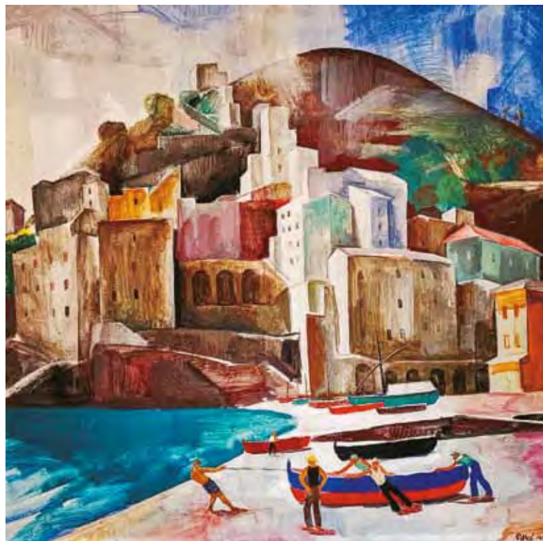
4. Patkó Károly: Olasz vidék, 1931 körül magántulajdon, egykor a Hofstätter-gyűjteményben