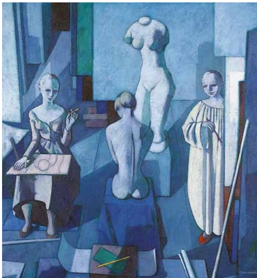
2. Felice Casorati: Lo Studio , 1934 magántulajdon