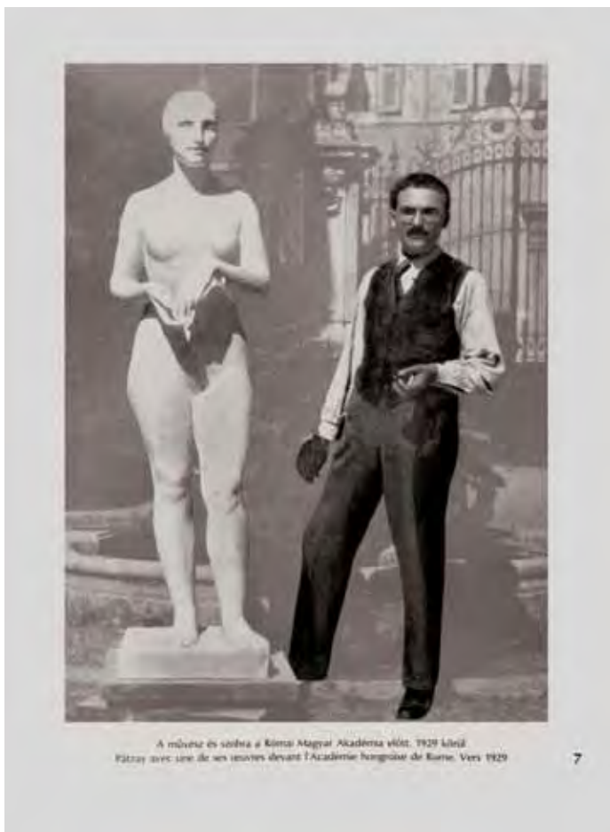
2. Pátzay Pál és szobra a Római Magyar Akadémia előtt, 1929 körül