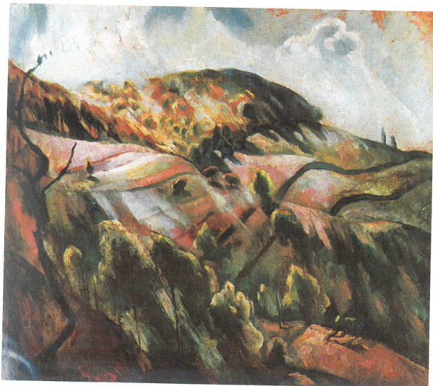
SZŐNYI István: Zebegényi dombok, 1923 Szőnyi István Emlékmúzeum, Zebegény