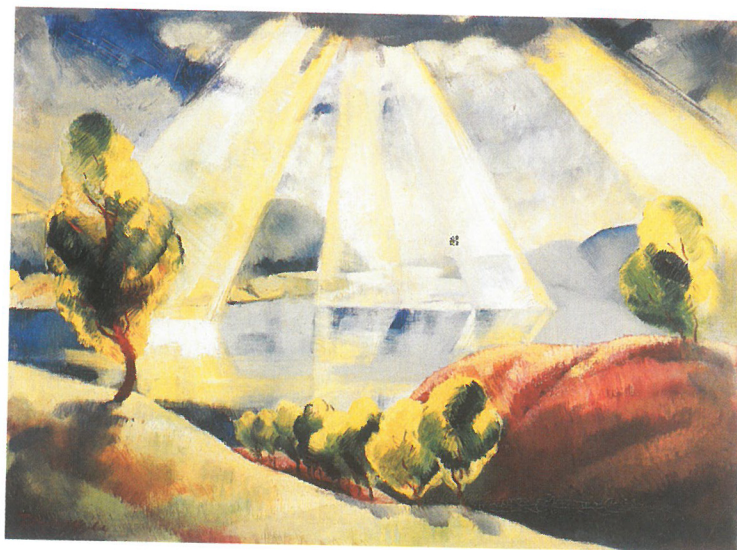
DUCSAY Béla: Fénycsónák a Dunakanyar felett, 1930 Magántulajdon

Zebegény és a családom. Közvetlenül az emberekhez közelálló és legközvetlenebb dolgokat szeretem festeni, mindig azok érdekelnek engem” – vallotta Szőnyi pályája végén is. Az 1920-as évek közepétől képeinek elsődleges szereplői családjának tagjai, felesége és gyermekei, az 1924-ben született Zsuzsa, illetve két esztendővel később érkezett Péter fia, valamint legszűkebb baráti társaságának tagjai voltak. Az évtized végén a falu és az ott élő emberek mindennapjai váltak alkotásainak legfontosabb témáivá, de a tárgyi környezet, a ház és az udvar intim részletei is megjelentek alkotásain. „Minden témám nemhogy Zebegényben, de a Zebegényben levő nagy szabad műtermemben születik meg, ahol két hegy, két völgy, almáskert és fenyőerdő változtatják egymást. Szinte ki sem kell mozdulnom onnan.” (Tóbiás 1964. 330.) A zebegényi táj, a ház mögötti dombra felfutó, hatalmas, öt holdas kert kaszállóval, kerekas kúttal rengeteg festői témát kínált Szőnyi számára, s a dombtetőről bontakozott ki a maga teljességében a Dunakanyar csodálatos panorámája. Egy interjú szerint maga a művész is az egyik legkedvesebb témájának a Dunakanyart tartotta , egyik utolsó megnyilatkozása is erről a ragaszkodásról tanuskodik: „Amíg lehet, kint is szeretnék már maradni, a kertben kedvenc padomról figyelve a felhők járását, a