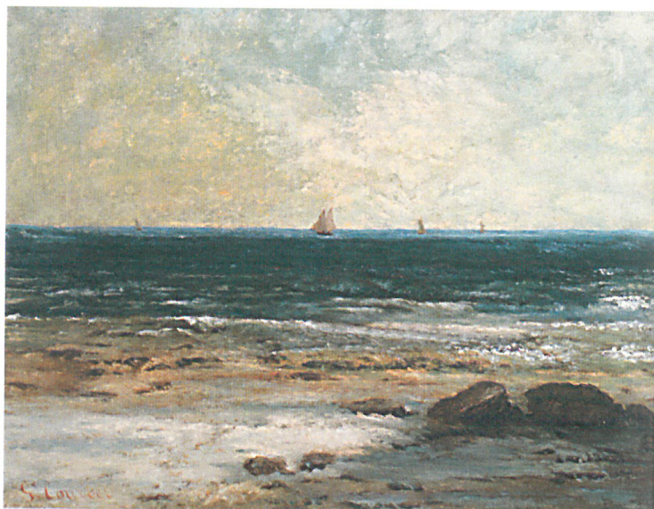
Gustave COURBET: Tengerpart Palavas mellett, 1860-as évek, magántulajdon