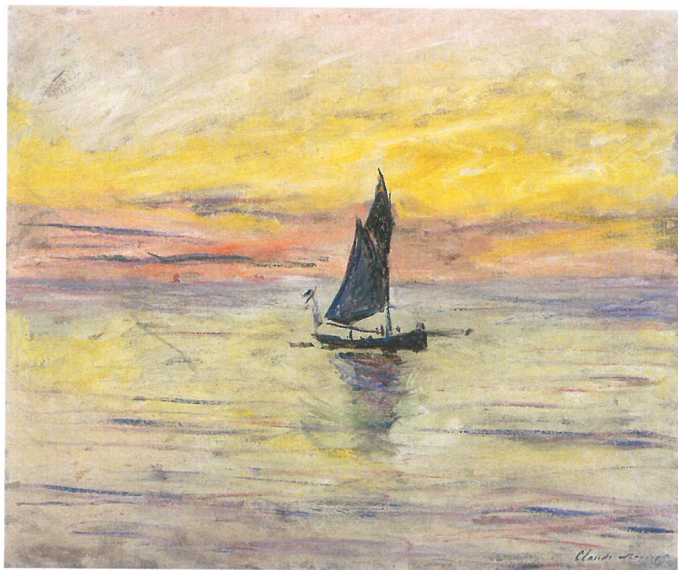
Claude MONET: Vitorlás (Esti hangulat), 1885. Párizs, Musée Marmottan Monet