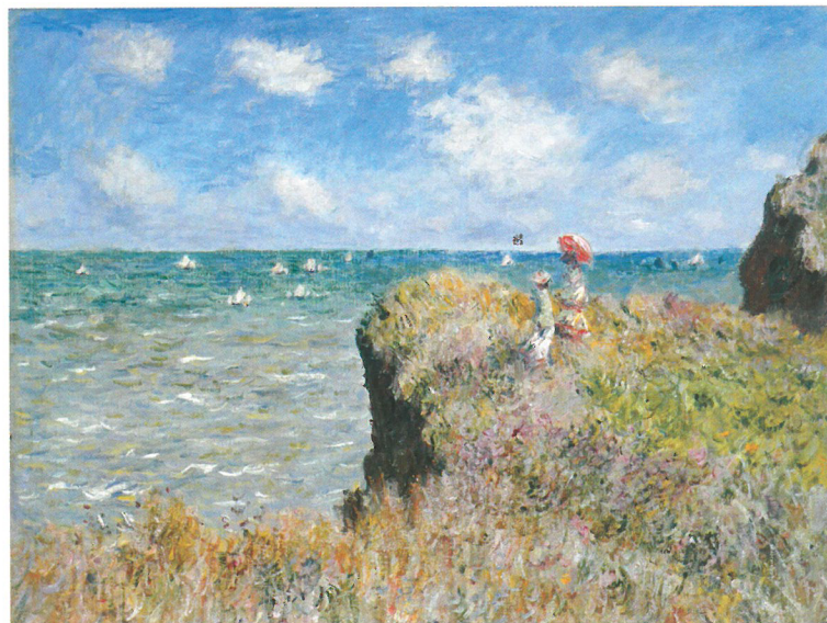
Claude MONET: Séta a sziklán, Pourville, 1882. Nationalmuseum, Stockholm

nagyközönség a Múcsarnokban, és aztán több mint 80 éves lappangás után bukkant fel újra.