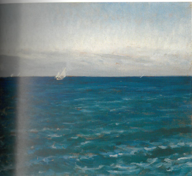
SZINYEI MERSE Pál: Capri (Tengerkép vitorlásokkal), 1902. magántulajdon