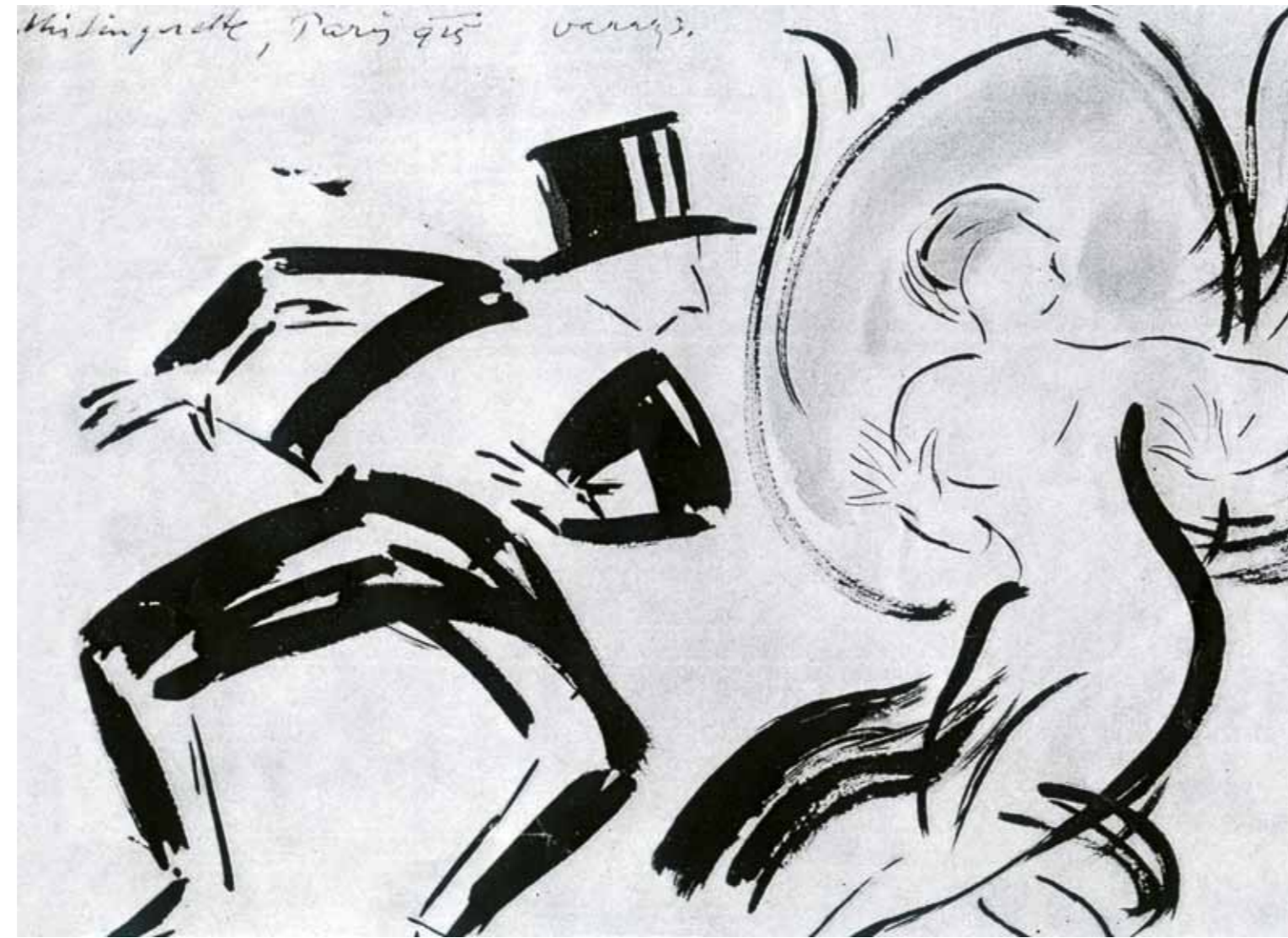
14. Vasary János: Mistinguett és partnere, 1925 magántulajdon

Vasary modernségét kitűnően jelzi, hogy a charlestonban egy olyan táncot fedezett fel, amely párhuzamba állítható az 1925-ben Párizsban megszülető art-deco esztétikájával is, amelyet a húszas években jazz stílusnak és cirkus stílusnak is neveztek. A tánckar derékszögben hajlított, egymást folyton elől-hátul keresztező, azaz charlestonozó lábai ugyanerre a vad és szertelen, de mégis szisztematikus logikára moznak. A charleston ráadásul minden ízében a globalizált euro-amerikai civilizáció terméke, hiszen a jazz zenére koreografált mozgás mintáját a korban nagy népszerűségnek örvendő, egzotikus afrikai táncok adták. Ahogy a festményein gyakran feltűnő Buddhák is mutatják, Vasaryt ez a fajta izzó, kulturális feszültség, a csillogó modern ruhába öltöztetett idegenség nemcsak mélyen elgondolkodtatta, de el is bűvölte.