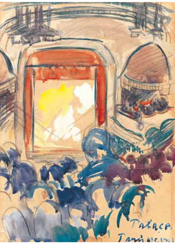
12. Vasary János: Palace, 1925 magántulajdon