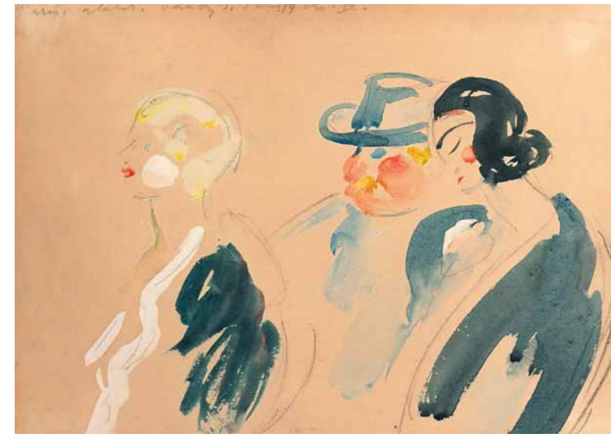
16. Vasary János: Párizsi alakok, 1925 magántulajdon