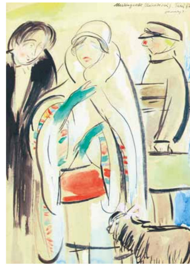
15. Vasary János: Mistinguett magántulajdon