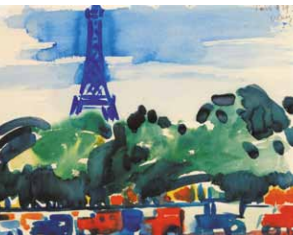
10. Vaszary János: Az Eiffel-torony, 1929 magántulajdon

Párizs hatására Vaszary művészete ismét megújult, fehérrel alapozott képein határozott, tévedhetetlen kézzel felvitt markáns vonalak és élénk színfoltok jelentek meg. A Párizsban megtapasztalt színes és szagos, szélesvásznú és szórakoztató, könnyed, de mégis meghökkentő „revü világ” festészete, költészete és zenéje ugyanis Vaszary szerint „mint a tavaszi üdítő zápor hull az eltikkadt szomjas lélekre”. (A KUT második kiállítása katalógusának előszava, 1925 – Vaszary 1994. 71.) Az 1925-ös párizsi napokról írott beszámolója persze nem mentes az Óvilág