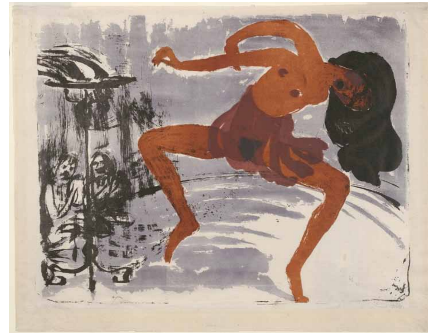
17. Emil Nolde: Táncosnő, 1913 MOMA, New York