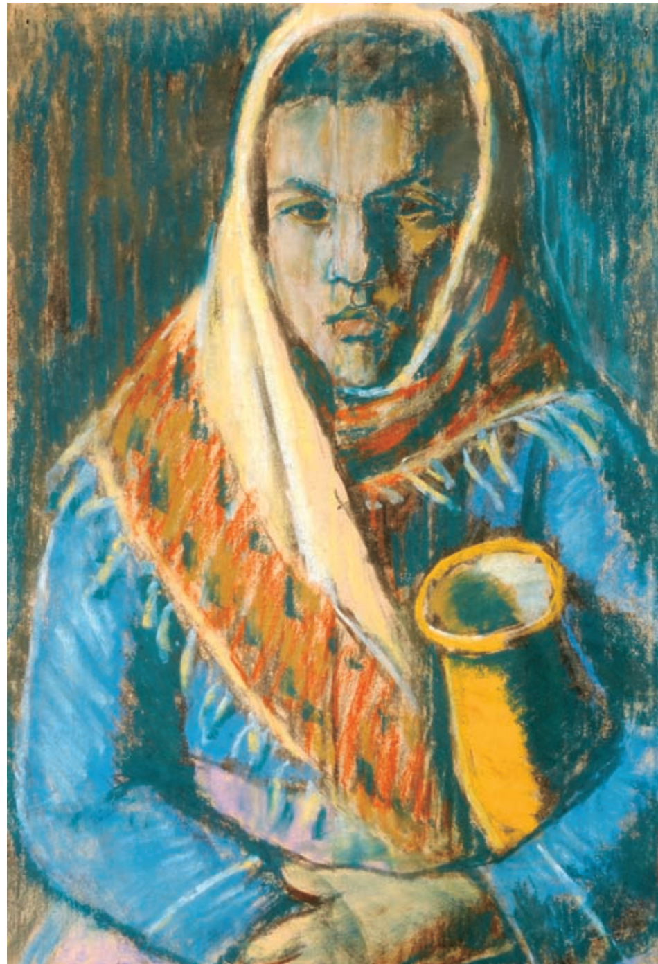
1. NAGY ISTVÁN (1873-1937) LÁNY SÁRGA KORSÓVAL Pasztell, papír, 70x49,5 cm Jelezve jobbra fent: Nagy István Kikiáltási ár: 950 000 Ft / 3 585 EUR