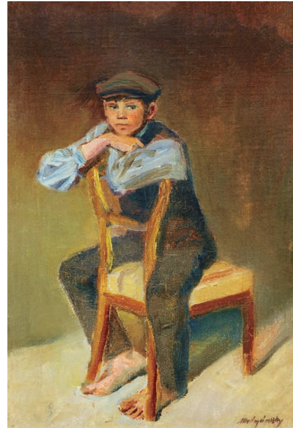
2. MEDNYÁNSZKY LÁSZLÓ (1852-1919) SZÉKEN ÜLŐ FIATAL FIÚ Olaj, vászon faroston, 37,5x27,5 cm Jelezve jobbra lent: Mednyánszky Kikiáltási ár: 750 000 Ft / 2 830 EUR