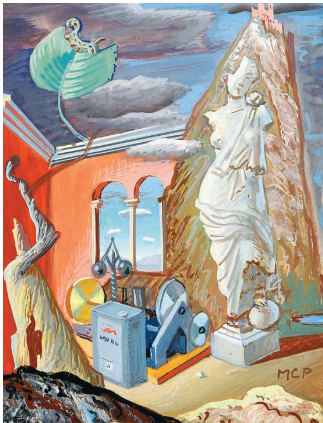
3. MOLNÁR C. PÁL (1894-1981)