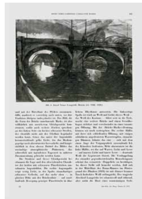
9. Képünk reprodukciója az Ekström-gyűjteményt bemutató tanulmányban (1975)