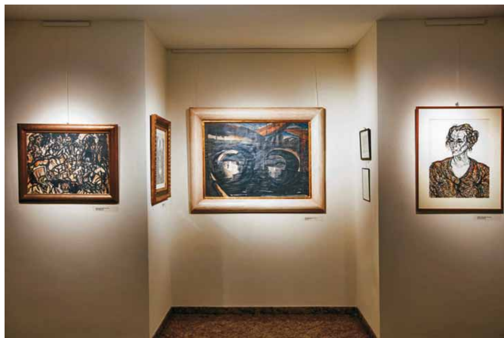
3. A festmény a Berlin-Budapest 1919-1933 című kiállításon, Moholy-Nagy László képei között