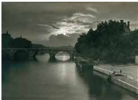
2. Híd a Szajján Párizsban, 1920-as évek