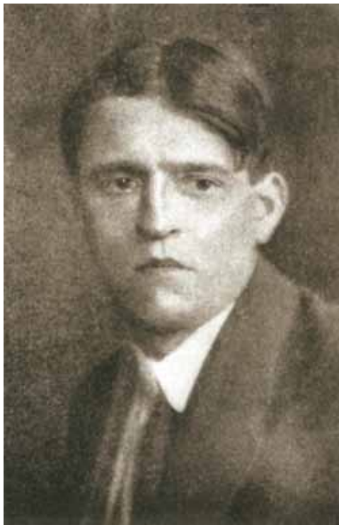
1. Nemes Lampérth József portréja