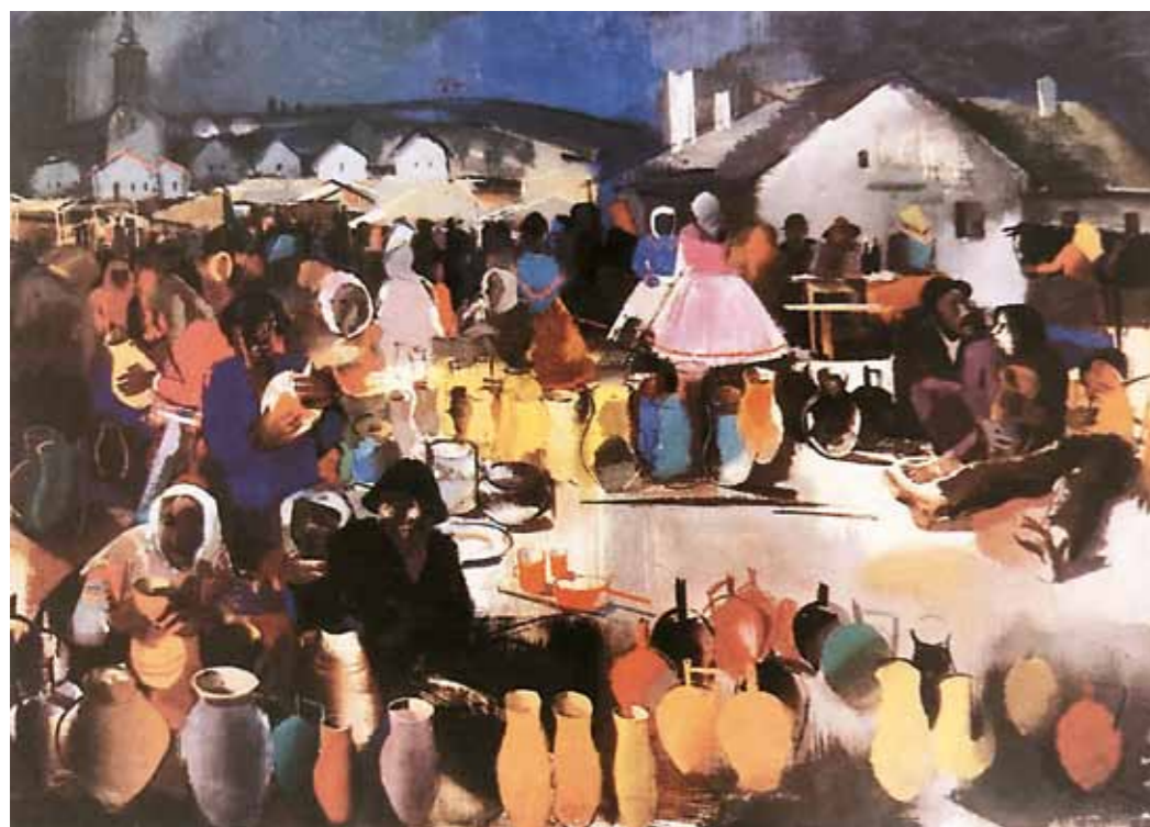
1. Aba-Novák Vilmos: Cserépvásár Damjanich Múzeum, Szolnok

Aratás. Negyvenöt kisebb-nagyobb figura elszórva a képtér teljes hosszában, széltében és mélységében. Döbbenetes könnyedséggel és hihetetlen nagyvonalúsággal kezelt formák, melyek néhány cikkantó ecsetvonásból formálódnak alakká, mezővé, edénnyé, bármivé, amit Aba-Novák észrevett és megörökítésre méltónak tartott.