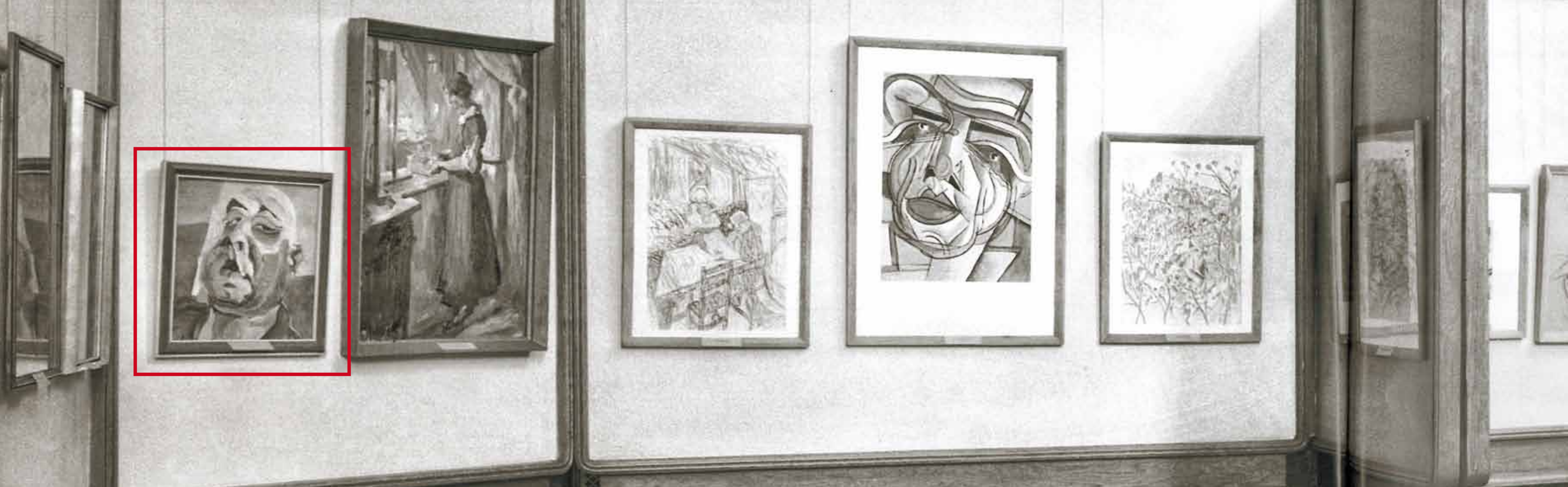
Képünk a Magyar Nemzeti Galéria Scheiber-kiállításán, 1964.