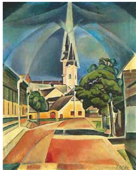
Kmetty János: Kecskemét, 1912. Magyar Nemzeti Galéria, Budapest