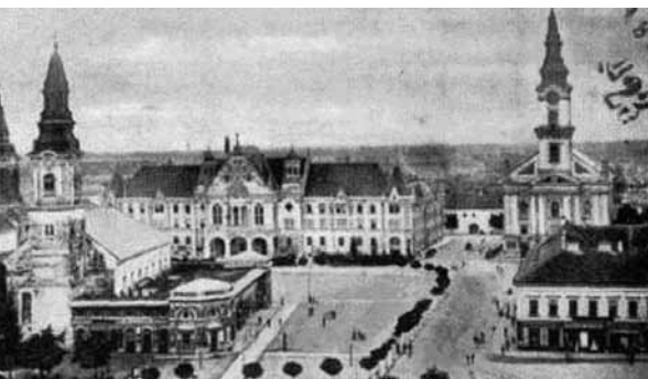
A kecskeméti fő tér a századforduló környékén