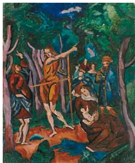
Perlrott Csaba Vilmos: Bibliai jelenet, 1910 körül, magántulajdon