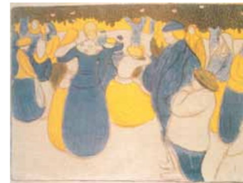
4. Rippl-Rónai József: Bretagne-i népünnep, 1886 magántulajdon