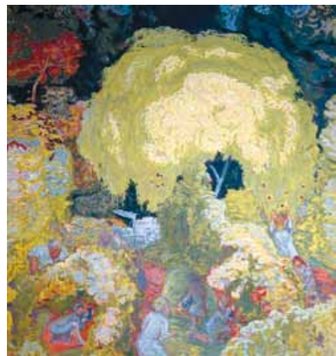
1. Pierre Bonnard: Ősz, 1912 Puskin Múzeum, Moszkva