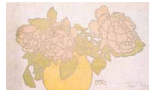
3. Rippl-Rónai József: Virágcsendélet, 1900 Magyar Nemzeti Galéria