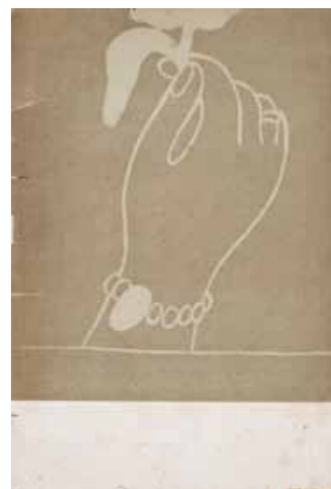
Georges Rodenbach: Les Vierges című kötetének címlapja