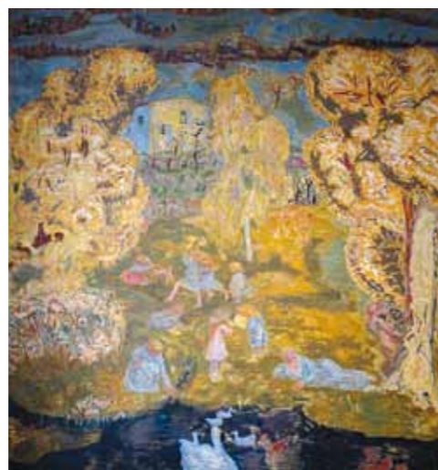
2. Pierre Bonnard: Kora tavasz, 1912 Puskin Múzeum, Moszkva