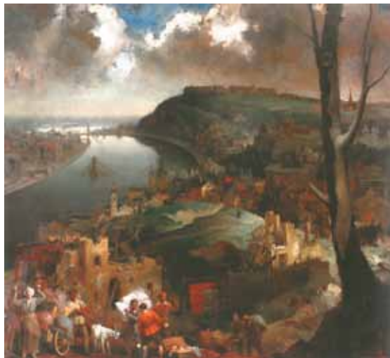
2. Kontuly Béla: Budapest drámája magántulajdon