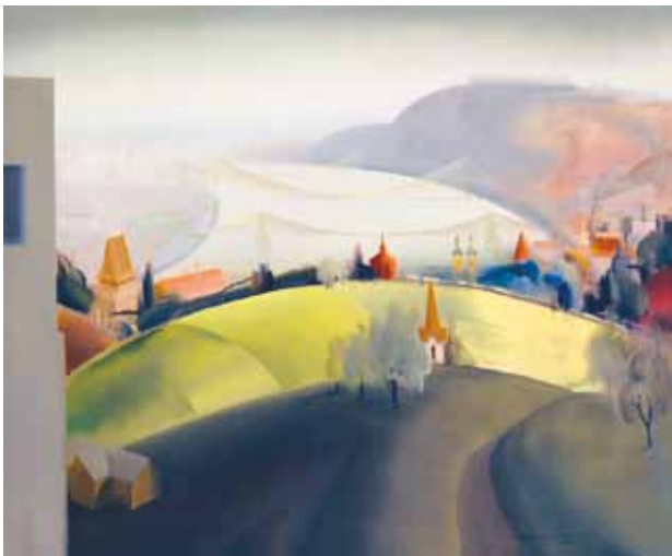
1. Kontuly Béla: Budapest látképe , 1936 magántulajdon