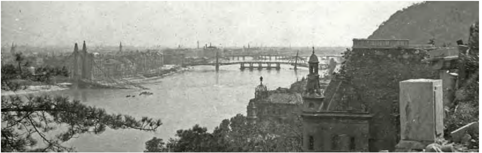
1. A budapesti Erzsébet- és Szabadság híd látképe a Várból, 1944

mokból szőtt „porcelánkép”-ként ábrázolva a főváros mesés szép vedutáját ( Budapest látképe , 1936, magántulajdon). Másrészt elképesztő az az ellentét is, amint a most aukcióra kerülő olajfestményen a szinte porig rombolt város fürdik az életadó tavaszi verőfényben. A valóság kendőzetlen rögzítése és a mindent túlélő, állandó újrakezdésre kész, nagybetűs Életbe vetett hit sugárzik Kontuly kíméletlenül őszinte és mégis gyönyörű művéből. Kopp Jenő Kontulyról szóló, a vele folytatott beszélgetések alapján készült máig kiadatlan kézírata, a festő életeseeményeinek, gondolatainak, valamint művészi elveinek igazi tárháza. Az 1947-ben született táblaképekről így írt: „...nem foglalkozik figurális témákkal,