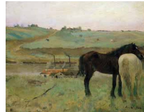
Edgar Degas: Lovak a mezőn, 1871. magántulajdon