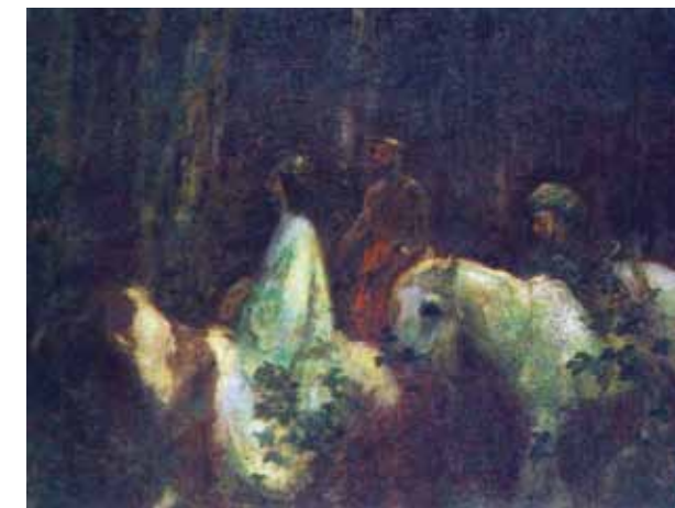
Ferenczy Károly: Háromkirályok, 1898. Magyar Nemzeti Galéria, Budapest