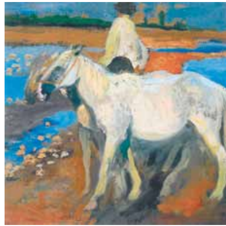
Ferenczy Károly: Lovak I., 1899. magántulajdon