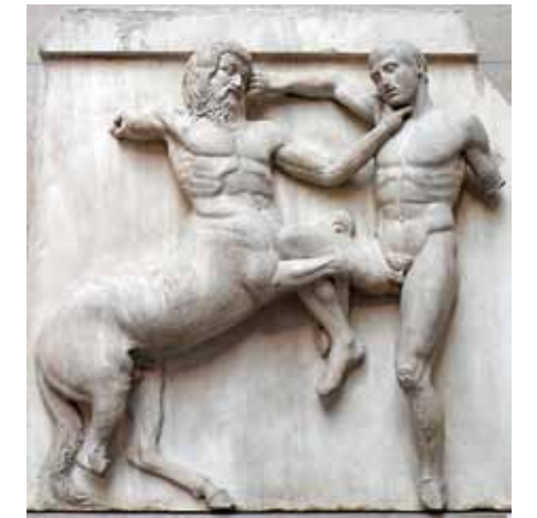
Parthenon fríz (részlet), i.e. 5. század közepe, British Múzeum, London