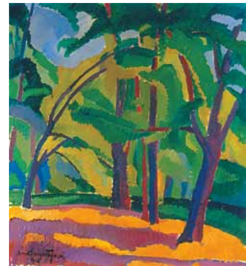
Nemes Lampérth József: Városligeti részlet, 1912 magántulajdonon