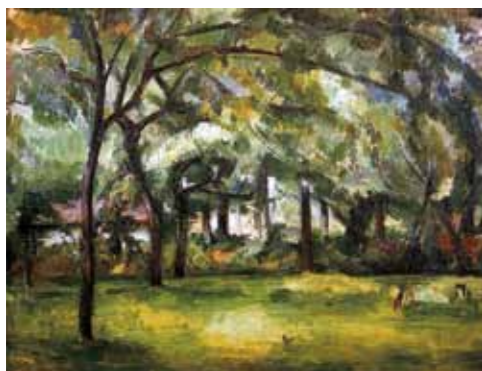
Paul Cézanne: Normandiai farm nyáron, 1882 magántulajdonon