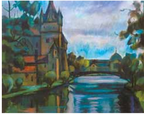
Kmetty János: Városliget, 1910 körül magántulajdonon