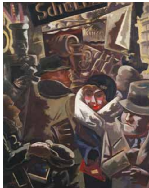
6. George Grosz: Berlini utca, 1916 magántulajon