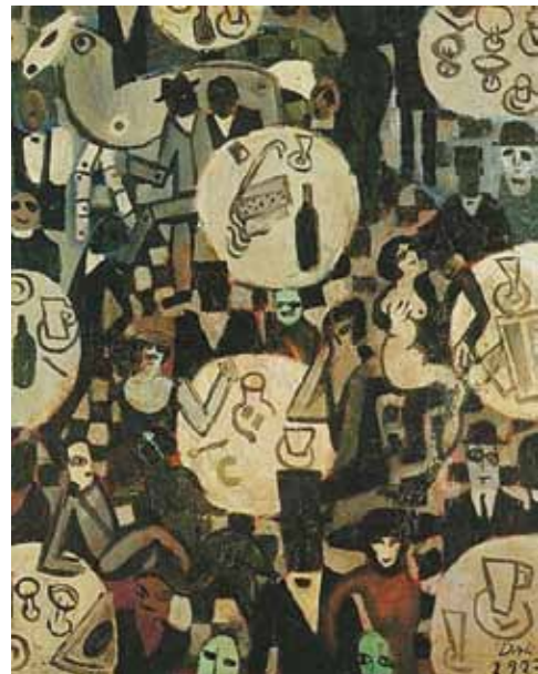
5. Salvador Dalí: Kabaré, 1922 Museum of Fine Arts, Boston