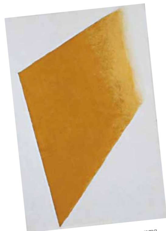
1. Kazimir Malevics: Sárga Paralelogramma fehér alapon, 1917-1918 Stedelijk Museum, Amsterdam