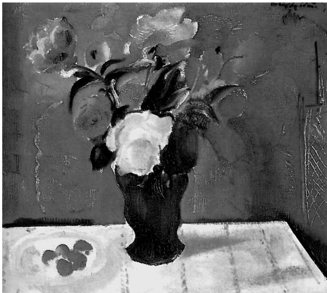
2. Márfy Ödön: Vörös csendélet, 1929 Városi Képtár - Deák gyűjtemény

szerepe miatt. Az egykori Nyolcak tagjai közül ő volt az egyetlen, aki nem kényszerült – illetve nem ment magától – tartósan külföldre a Kommun bukása után. Így igen gyorsan visszatért a magyar művészi életbe. Nagy kedvvel dolgozott és művei egyre nagyobb népszerűségnek örvendtek mind a közönség mind a kritikusok körében. Tekintélye nőttön-nőtt, olyannyira, hogy 1927-től megválasztották a hazai modern törekvéseket széles táborba tömörítő KUT elnökének is. Ezt a tisztséget jó tíz éven keresztül viselte. Bár hosszabb időre ekkoriban nem hagyta el az országot, festményei rendre eljutottak külföldre: Bécsbe, Fiuméba, Nürnbergbe, a Velencei Biennáléra, a Barcelonai Világkiállításra, lengyel városokba és a KUT németországi körúttjára. 1928-ban sokat ígérő, önálló tárlattal mutatkozott be a tengerentúlon: Washingtonban és New Yorkban. A kiállított művek zömét megvásárolták az amerikai gyűjtők.