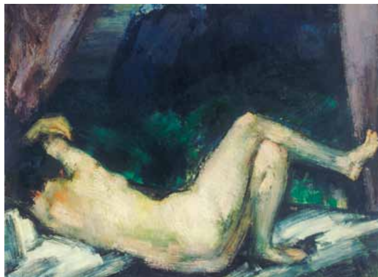
1. Vaszary János: Fekvő nő, 1919 körül magántulajdon