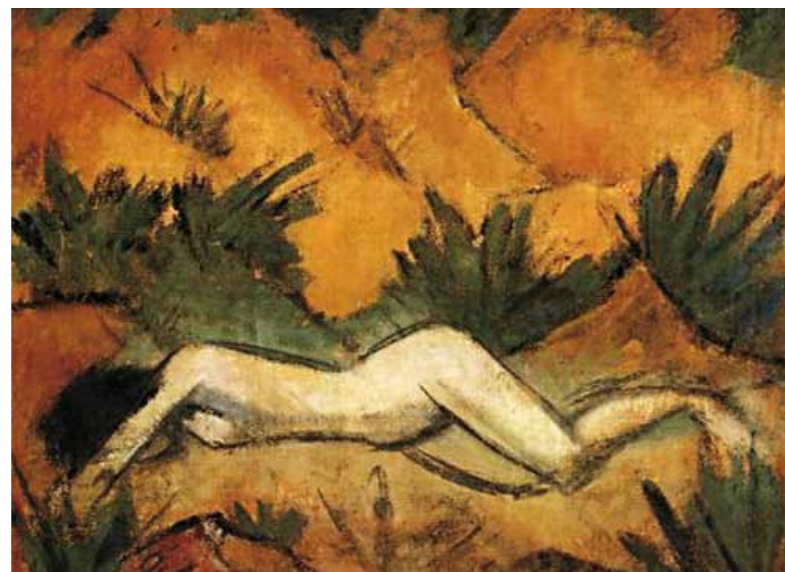
2. Otto Müller: Akt dűnék között Galerie St. Etienne, New York City

A meztelen női test művészi megragadása, Vaszary János teljes pályáivén folyamatosan jelenlévő főtémaként szerepelt. A párizsi tanulmányok naturalista ábrázolásait a századfordulón szecessziós stílusú aktok követték, majd az első világháború előtt a téma impresszionista, azt követően pedig expresszív megfogalmazásai következtek. A két háború között, az európai trendekkel is párhuzamosan, Vaszary art deco női aktábrázolások gyönyörű sorozatával tette fel a koronát, több mint négy évtizednyi munkásságára. A mester minden korszakában kiemelkedőt alkotva vált a modern magyar festészet egyik legjelentősebb alkotójává.