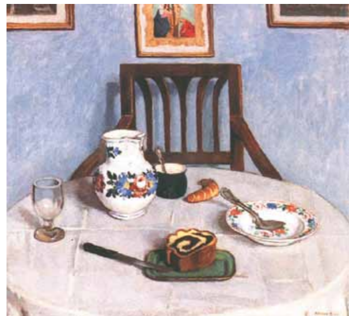
2. Fényes Adolf: Mákoskalács, 1910 Magyar Nemzeti Galéria, Budapest