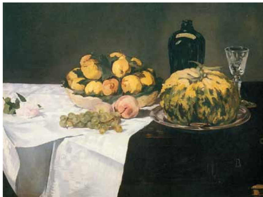
1. Édouard Manet: Csendélet dinnyével és barackokkal, 1866 National Gallery of Art, Washington