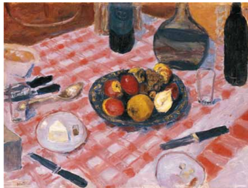
3. Pierre Bonnard: Tarka asztal, 1916 Metropolitan Museum of Art, New York