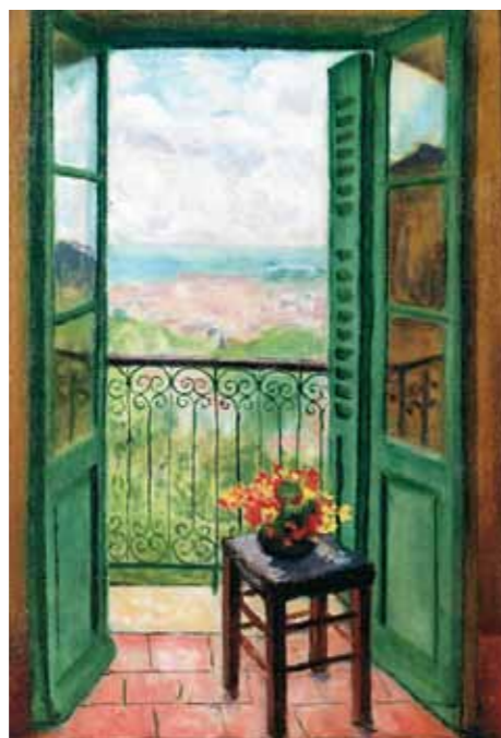
2. Albert Marquet: Ablak az algír öbölre, 1913 magántulajdon