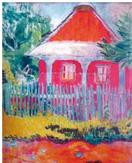
1. Schönberger Armand: Vörös falú ház, 1910 Zsidó Múzeum, Budapest