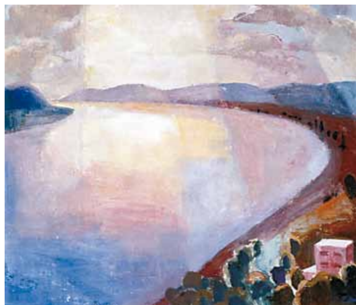
2. Patkó Károly: Zebegényi részlet, 1930 körül magántulajdon