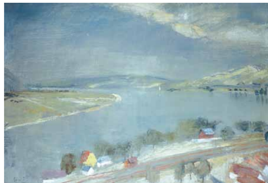
3. Szőnyi István: Szurke Duna, 1934 magántulajdon