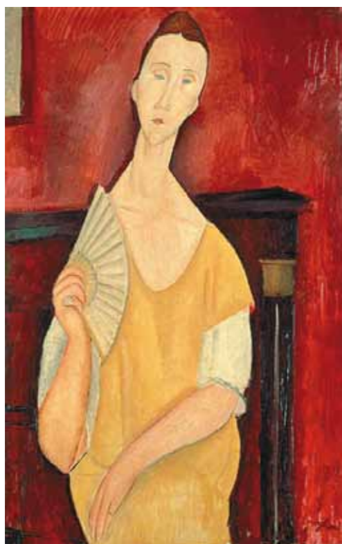
1. Amedeo Modigliani: Nő legyezővel, 1919 Musée d'Art Moderne de la Ville de Paris, Párizs