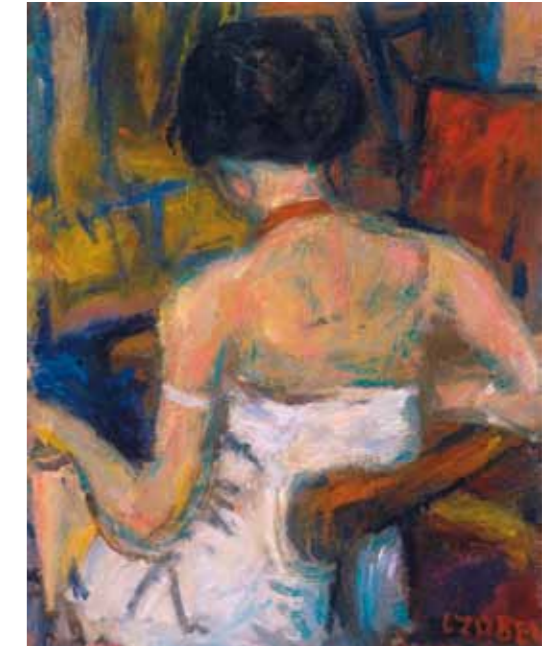
5. Czóbel Béla: Ülő háttakt vörös nyakkéssel magántulajdon

Műveinek rendszeres témája a nő. Portréin és aktjain a női test érzékiségét, a bőr szinte kitapintható, puha bujaságát, a pihenés perceibe belefeledkező létezését ragadja meg. Frank János írta, hogy „ugyanannyi szexet talállok Czóbel nyakig begombolt ruhájú leányportéjában, sőt, a tájképeiben is”. 2 Kratochwill Mimi is kitér Czóbel „férfias” festészetére, 3 amely nem a témaválasztásra, hanem a stílusra, a megformálásra vonatkozik, ahogyan – különösen az – érett periódusában: az ecsetet kezeli, vagy a festékekkel, a színekkel és a formával bánt. Művészete ekkor nem (franciásan) dekoratív, légies vagy könnyed, inkább markáns, Rouault-hoz hasonlóan nyers. Nincs „tárgyi motiváció, hanem az alkotó maga, aki belehelyezkedik tárgyába és így festi azt láthatóvá maga körül. Nem mondhatjuk tehát, hogy lefest valamit, hanem azt a viszonyt, képzetet és véleményt festi meg, amire a tárgy inspirálja” – írta vele kapcsolatban Kassák Lajos. 4 Formái nem pontosan körülráltak, a kontúrokkal és a tónusokkal megtöri a felületüket, újabb dimenziókat adva nekik, amely megkívánja a nézőtől a mélyebb szemlélődést, és elmerülést.