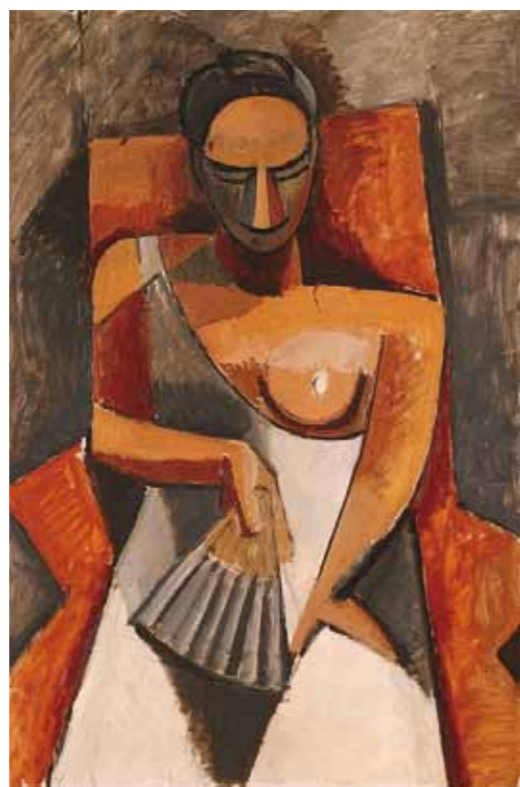
2. Pablo Picasso: Nő legyezővel Ermitázs, Szentpétervár

Czóbel húsz éves korától a – kiváltságos – világpolgárok életét élte, a nyarakat többnyire vidéken, rendszerint tanulással és munkával töltötte (Nagybánya, Nyergesújfaló, Bergen, Würzburg, Gros Rouvre, Hatvan, Szentendre), míg a hidegebb hónapok alatt visszament abba a nagyvárosba, ahol éppen huzamosabb időt töltött (Budapest, Párizs, Amsterdam, Berlin). Ugyan volt ezekben a helyváltoztatásokban némi kényszer is, hiszen a két világháború többszörösen is me-