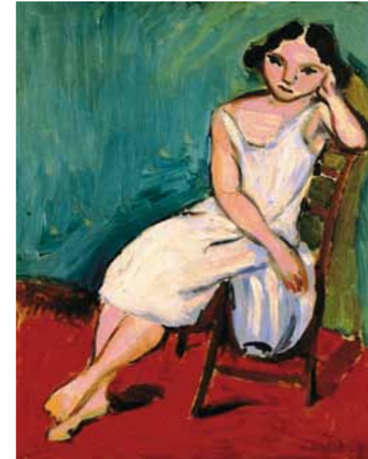
3. Henri Matisse: Ülő lány, 1909 magántulajdon