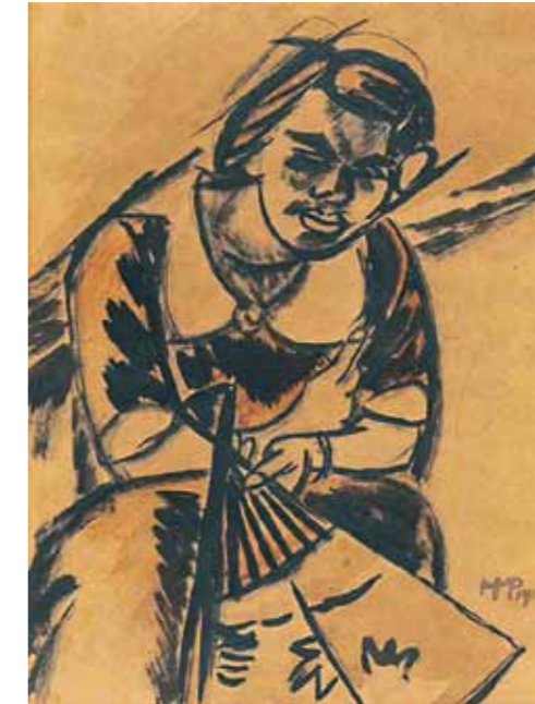
4. Max Pechstein: Nő legyezővel, 1912 magántulajdon