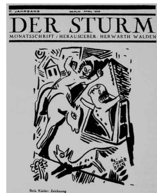
1. Kádár Béla Szóktetés c. rajza a Sturm folyóirat címlapján, 1926