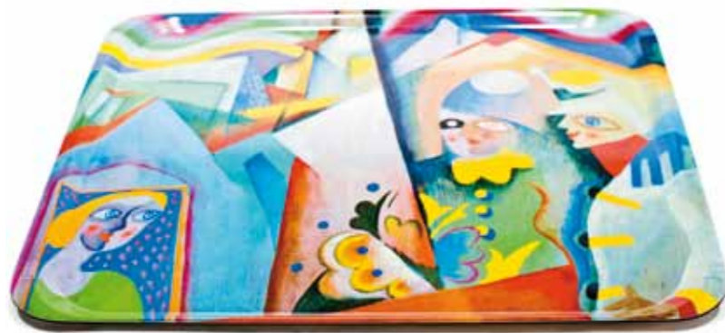
5. A festményből készült design tálca, Virág Judit Galéria