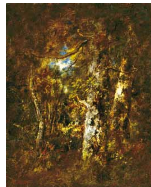
1. Narcisse Virgile Diaz de La Pena: Erdőrészlet, 1873. Magántulajdon