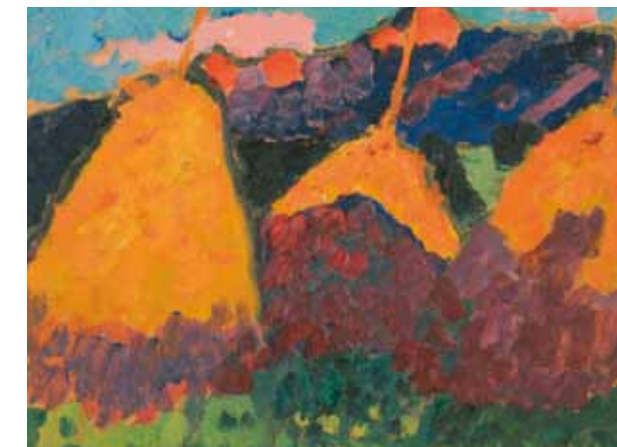
Alexej Javlenzkij: Murnau-i részlet boglyákkal, 1908-1909, National Gallery of Canada, Ottawa