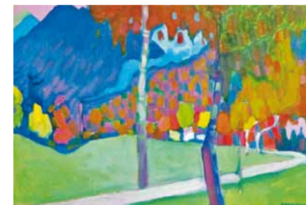
Vaszilij Kandinszkij: Őszi tanulmány Oberau mellett, 1908. Stadtische Galerie in Lenbach, München