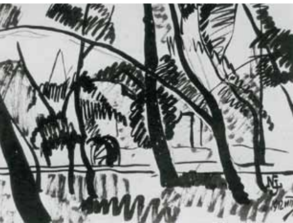
Nemes Lampérth József: Városligeti részlet, 1912. magántulajdon