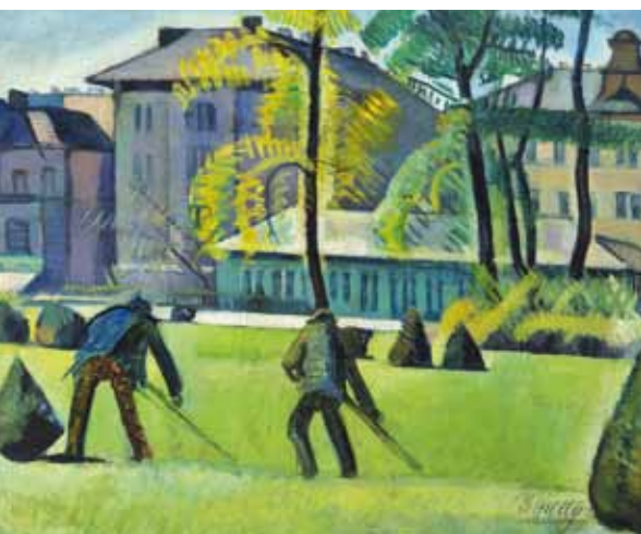
Kmetty János: Városliget, 1910-es évek első fele, magántulajdon