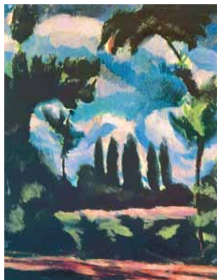
Uitz Béla: Fák, 1916. Magyar Nemzeti Galéria, Budapest