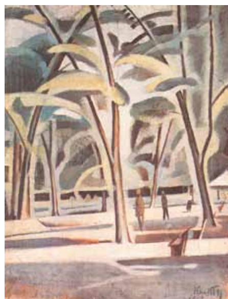
Kmetty János: Városliget, 1912. Budapesti Történelmi Múzeum, Budapest