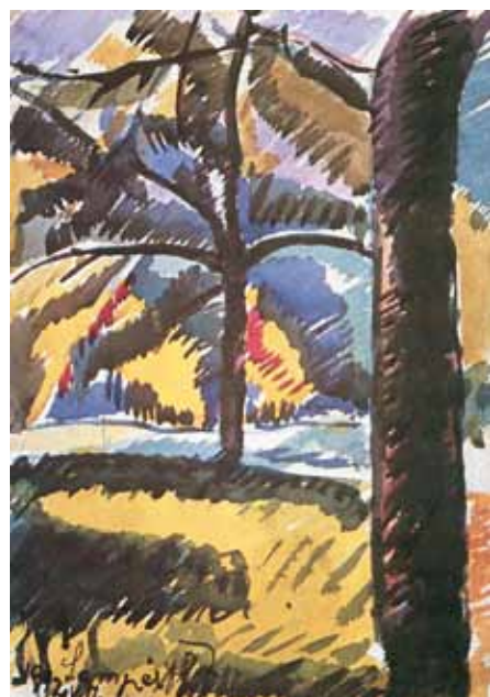
Nemes Lampérth József: Városligeti részlet, 1912. Kiscelli Múzeum, Budapest