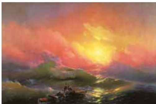
2. Ivan Ajvazovszkij: A kilencedik hullám, 1850 Orosz Nemzeti Múzeum, Szentpétervár