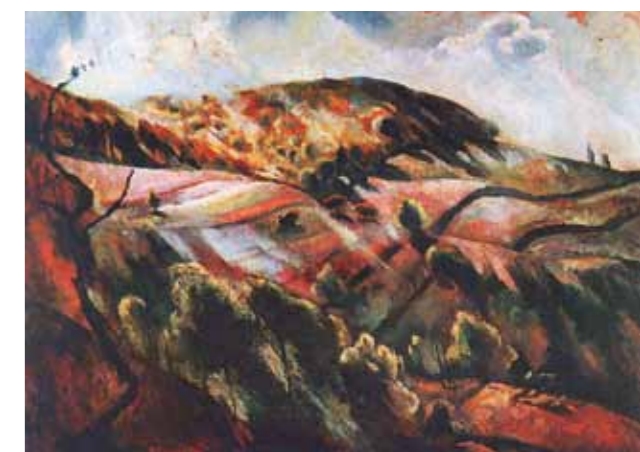
2. Szőnyi István: Zebegényi dombok (Napfényes táj), 1923. Szőnyi István Emlékmúzeum, Zebegény