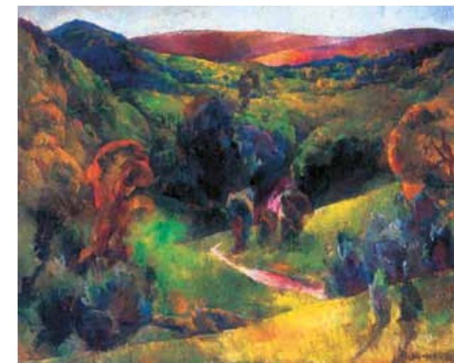
3. Aba-Novák Vilmos: Tájkép, 1924 körül magántulajdon