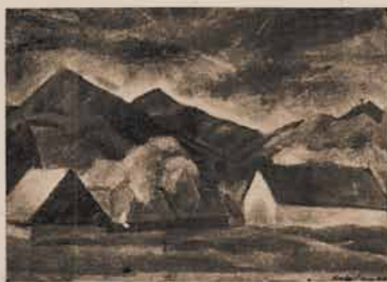
KORDA VINCE: Nagybányai házak.