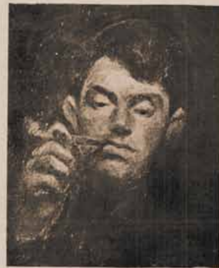
KORDA VINCE: Önarckép.

Úgy-e, így van, Ella? Lám, lám, most megint mintha látnám. In-gadozó kézzel tartja a levelet, olvassa a sorokat homályosul szemmel és a lelkében lassan, szomorúan, áhítatosan esendben megszólal egy hangszer mélabús, ábrándos, elmesélő hangja. Hegedűhúrokban lágy, zokogó szava, reszkető sírása felhatol a szívbe, forgatja a vonót visszaféret emlékek sokasodó raja. És