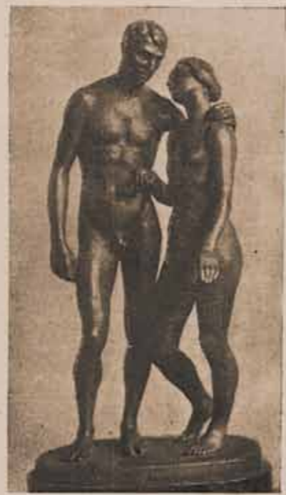
MINDSZENTY FERDEL LAJOS: Ádám és Éva.