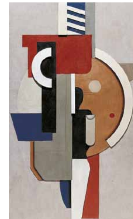
9. Willi Baumeister: Falkép körrel , 1923 Centre Georges Pompidou, Párizs

Sajnos a kiállítás műtárgylistája nem maradt fenn, azonban a Der Cicerone című művészeti folyóiratban megjelent ismertetés alapján rekonstruálható, hogy Bortnyik milyen festményeket állított ki. 8 Az ismertetőből kiderül, hogy Bortnyik a kiállításon szereplő műveinek alapvetően három csoportját lehetett megkülönböztetni: a konstruktivizmus hatásáról árulkodó geometrikus műveket, a geometrikus térben elhelyezett „próbabaszerű” alakokkal gazdagított figurális alkotásokat, valamint az absztrakt csendéleteket, melyek „inkább hengerek, urnák, gömbök zárt plasztikus hatását veszik alapul a tárgyak meggyőzően plasztikus összjátékaként”. A kiállítás anyaga feltehetően nagyrészt elkelt és magángyűjteménybe került. A ma ismert absztrakt csendéletek az 1960-as években már a hamburgi Siegfried Poppe tulajdonában voltak, 9 egy pedig 1960-ban a Nierendorf Galéria tulajdonából került a berlini Neue Nationalgalerie gyűjteményébe. Bortnyik absztrakt csendéletei csak évtizedek múltán, az 1990-es években kerültek magyar magángyűjteménybe.