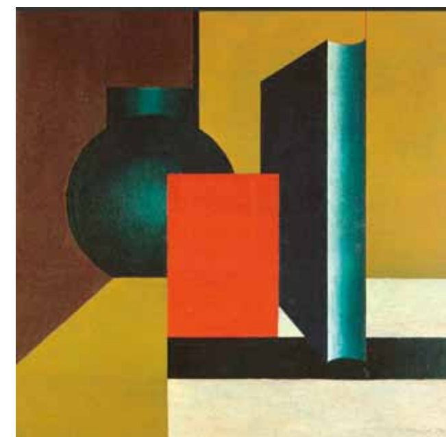
4. Bortnyik Sándor: Kompozíció gömbbel, 1923 Staatliche Museen zu Berlin – Nationalgalerie, Berlin (a Galerie Nierendorf gyűjteményéből)