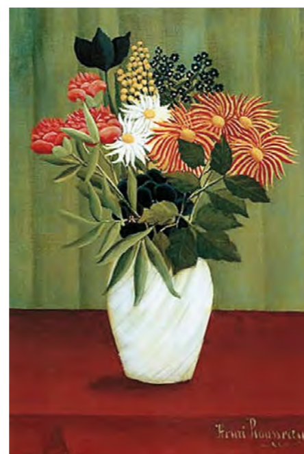
3. Henri Rousseau: Virágcsokor margarétával, 1910 magántulajdon