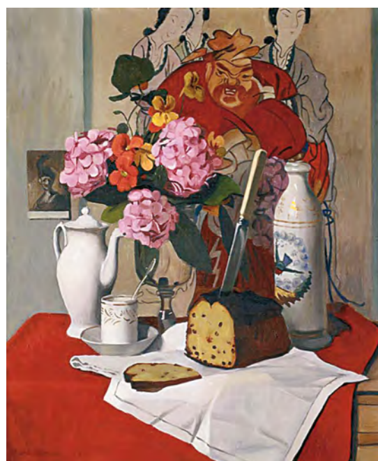
1. Felix Vallotton: Csendélet vázával, 1920 körül The Metropolitan Museum of Art, New York