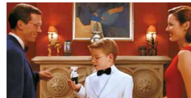
10. Berény Róbert Alvó nő fekete vázával c. festménye a Stuart Little c. filmből