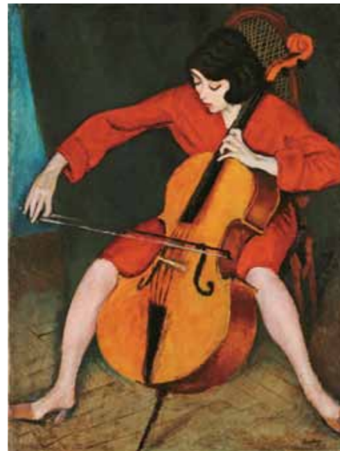
2. Berény Róbert: Csellózó nő, 1928 Magyar Nemzeti Galéria, Budapest