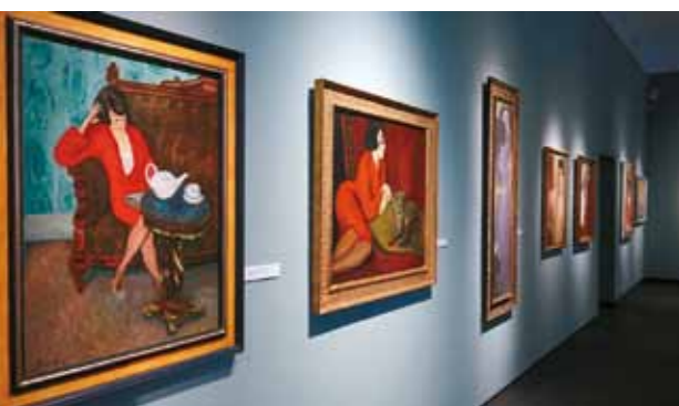
4. A festmény a Festők, Műzsák, Szerelmek című kiállításon, 2016

A csellózó nő tárgyalt képünkön ugyanabban a vörös házikabátjában jelenik meg, de ezúttal nem az erotikát sem mellőző csellójátékában merül el, hanem az újság híreiben. Végtelen, időtlennek tűnő béke és a megtalált harmónia beteljesedett öröme árad e képről.