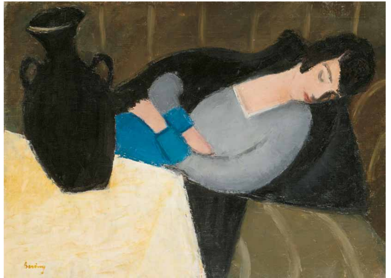
9. Berény Róbert: Alvó nő fekete vázával (Alvó nő), 1927-1928 magántulajdon