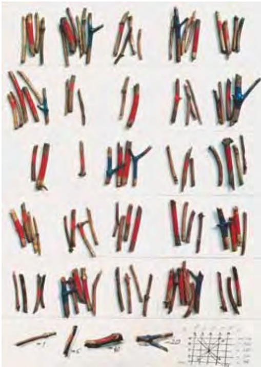
1. Maurer Dóra: Mennyiség tábla, 5. 500 érték, mágikus négyzet, 1972