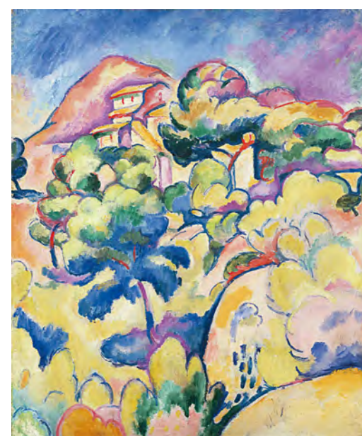
2. Georges Braque: La Ciotat lát képe, 1907 MOMA, New York