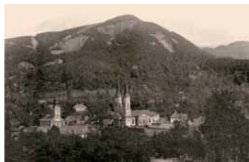
1. Felsőbánya, 1910-es évek archív fotó

„Annyira tetszett neki a hely, hogy meggyőzte budapesti társait egy kalandos és távolinak tűnő expedíció megszervezésére” – írja a felsőbányai hónapokról Murádin Jenő.