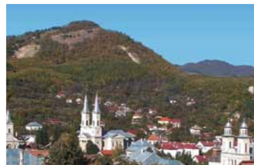
3. Felsőbánya napjainkban