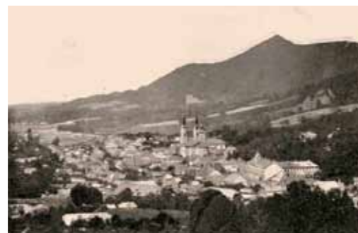
2. Felsőbánya, 1910-es évek archív fotó