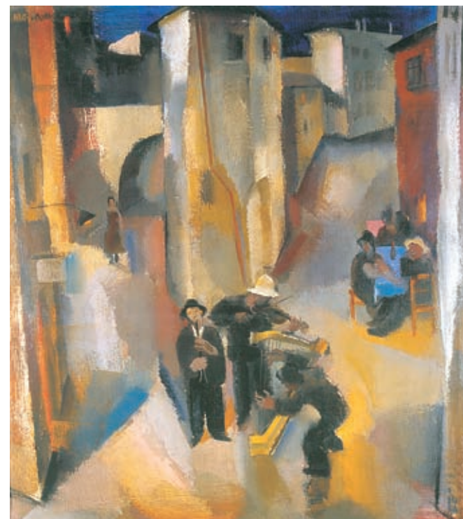
Aba-Novák Vilmos: Utcazenészek, 1929, magántulajdon