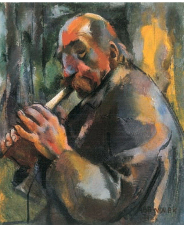
Aba-Novák Vilmos: Furulyás, 1927 körül, magántulajdon