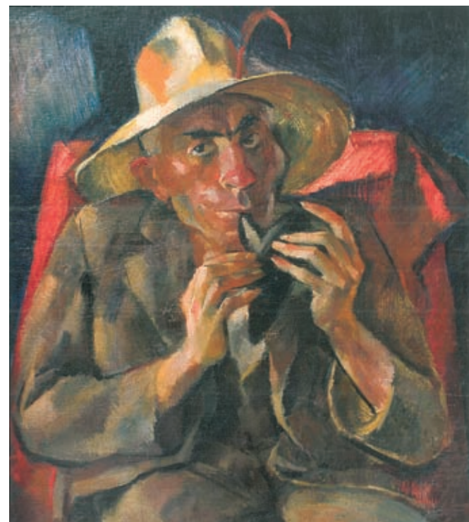
Aba-Novák Vilmos: Okarinás, 1929, lappang