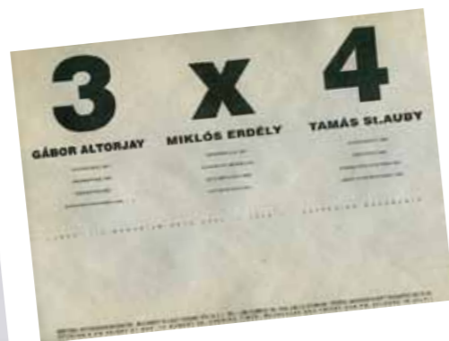
2. A 3x4 című kiállítás meghívója.