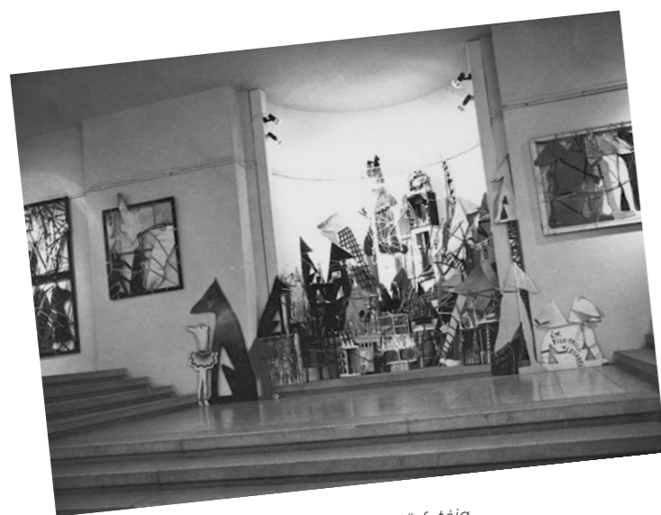
1. A székesfehérvári kiállításának enteriőrfotója, Csók István Képtár, Székesfehérvár, 1983