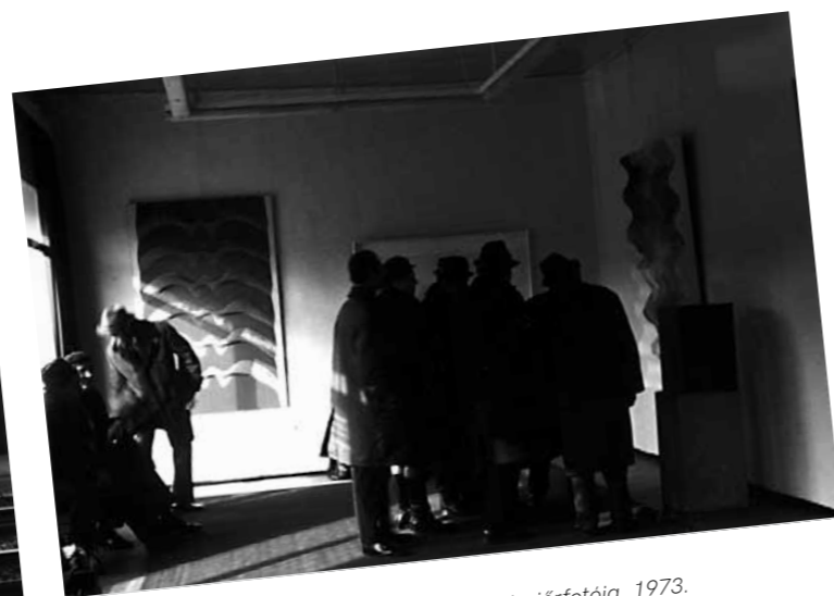
2. A Hetente más festmények c. kiállítás enteriőrfotója, 1973.

Keserü Ilona a hetvenes évektől egyre inkább tudományos módszerességgel fordult a színekhez, amely egyfelől a lehető legszélesebb színkálát (a szivárványszínek) bevezetéséhez vezetett művészetében, másfelől a színek törvényszerűségeinek, különféle funkcióinak és kiváltott élményeinek a gyakorlatban megvalósuló hatásaira, a közös testi tapasztalatokra is kitértek vizsgálódásai. Keserü életművében a szín (vagy a szintelenség) épp annyira elemi, mint a hullámok, ősfarmák és anyagok felfedezése. Utóbbiakhoz hasonlóan téralkotói, ritmikái, zenei, valamint pszichológiai vetületei is vannak. Keserüt a színek innentől fogva szinte behálózták; a Belgrád rakparti műterméről készült fotókról