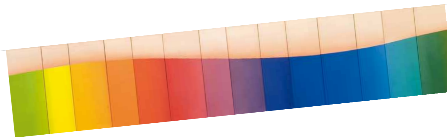
3. Keserü Ilona: A világból I. , 1974, Antal-Lusztig gyűjtemény