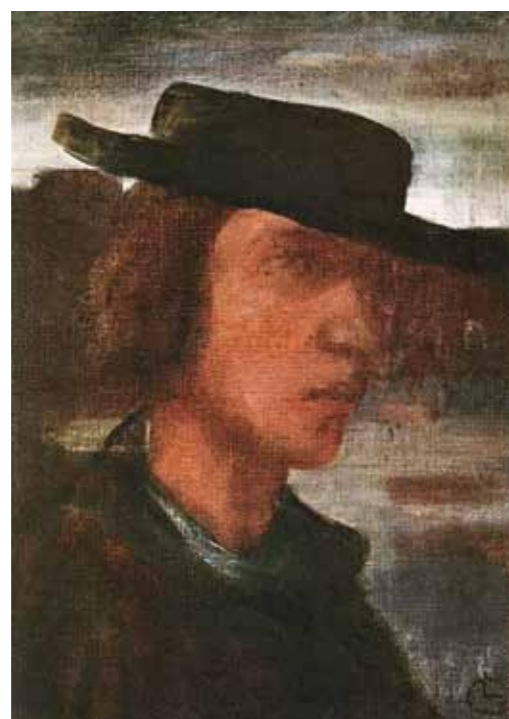
2. Gulácsy Lajos: Kalapos önarckép, 1909 magántulajdon

Ne feledjük, a fiatal Gulácsy akkor festett tendenciózusosan aranybarna-rőtes-füstszerű színű képeket, amikor az éppen csakhogy megszülető modern magyar festészet megszabadult e komor hangulatú színvilágtól, és felfedezte magának a fényt és a tiszta színeket (ld. nagybányai festészet, a magyar fauves). A kortársak persze nem mentek el szó nélkül az álomszerű, ódon hangulatú, sötét világot megidéző képek mellett, amelyek alkotójának fiatal kora ellenére, mind az elmúlásról és elvagyódásról szólnak. A MIENK 1909-es nagyváradi csoportkiállítása kapcsán említik, hogy Gulácsy egy fantázia-temetést rendezett, és erősen vonzódik a halál szertartásos misztériuma iránt. 3 A Nyugatban Füst Milán írt elismerően a festő éjszakai tájairól és álomjeleneteiről. 4 Dénes Zsófiától pedig tudhatjuk, hogy Bölöni György „ Most jön a firenzei temetés! ” – felkiáltással köszöntötte egyik alkalommal az