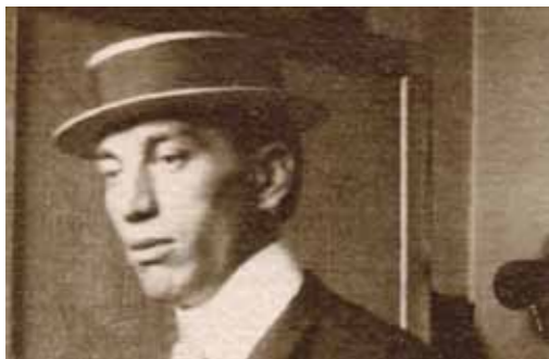
1. Gulácsy Lajos 1907-ben