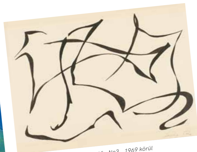
2. Hortobágyi Endre: Kalligráfia No3., 1969 körül