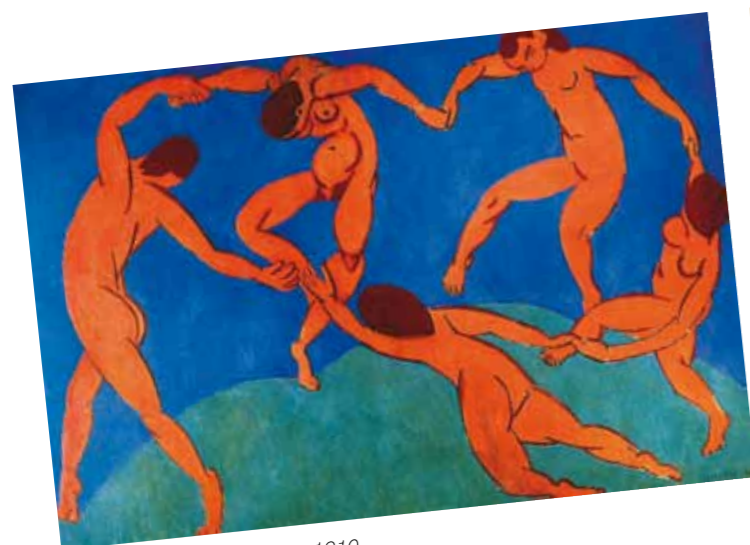
1. Henri Matisse: A tánc, 1910. Ermitázs Múzeum, Szentpétervár