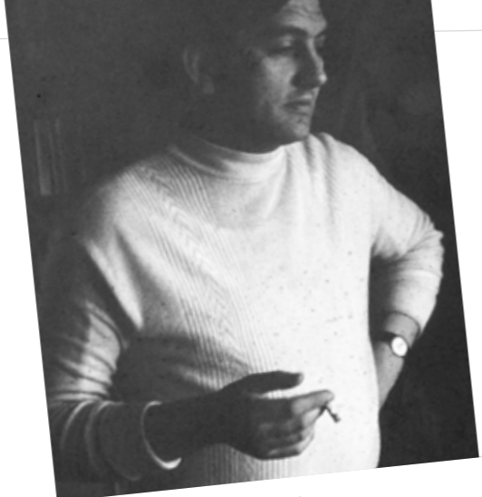
1. Hortobágyi Endre portréja