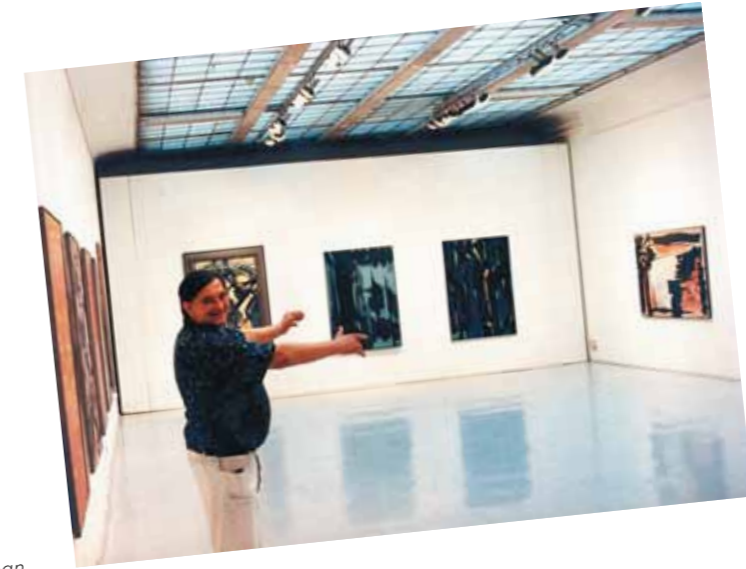
3. Hortobágyi Endre kiállítása az Ernst Múzeumban

A mozgalmas, tónusokban gazdag színelületet felhasító, leginkább kalligrafikus gesztusokra emlékeztető vonalak rajzolatai mintha véletlenszerűen fonódnának egymásba a meleg színektől lángoló felületen. A fényvel telített, de síkszerű háttér okker, vörös és fekete színei egyszerre idézik a történelem előtti bartlangrajzok ősi vizualitását és a bizánci mozaikok egységes, de milliányi apró darabkákból építkező aranszín ragyogását. Míg a formák eszünkbe juttatják a parázsló botokkal levegőbe írt fényrajzok fotókon rögzített pillanatnyiségét is. Az organikus jelekként egymásba fonódó szalagok anyagszerűségük révén térben kibomló kontúrokat alkotnak, melyek egyszerre határolnak körül és nyitnak egybe formákat, melyek az állandó transzformációk ritmusára megképzik, majd engedik felbomlani a látványvilágból absztrahált minőségeket. Mintha H. Matisse Tánc című festményének dinamikája és Martyn Ferenc 1950-es évekbeli erővonalakra redukált kompozíciói találkoznának ezen a szuggesztív festményen, melyhez több tanulmány is készült. Hortobágyi a természeti környezet