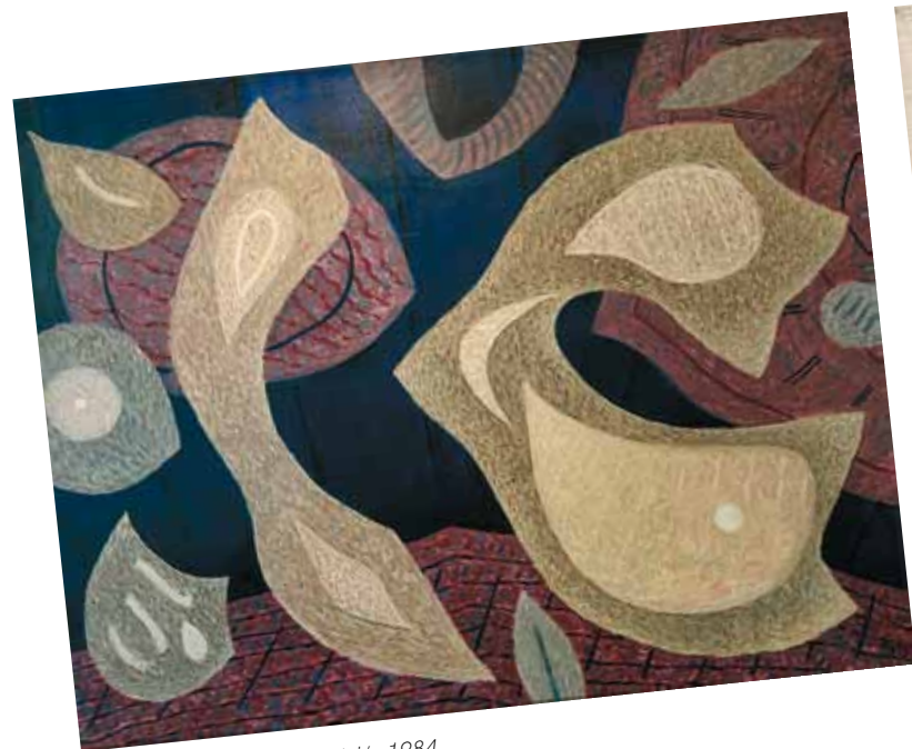
3. Henri Goetz: Kompozíció, 1984 magántulajdon