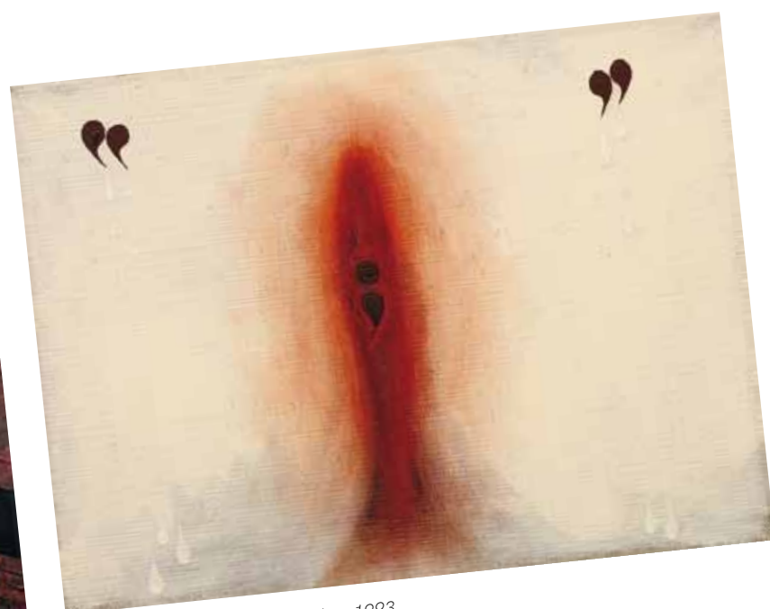
4. Mira Schor: Spanyol festmény, 1993 magántulajdon

a képet. Megjelenik a vászondomborítás érzéki és a tengert imitáló ríktó kék lágycírcvonalában, a kép jobb alsó sarkából érkező sötétség befelé áramlásában, a hetvenes évek ceruzarajzait idéző vonalkázásokban, amelyek mint egy hevesebb fuvalat, felborzolják és megmozgatják a felületet. Végül ott van az utóképekről is ismert, tengeralatti neonrózsaszín pálcika alakjában. A képen minden mozog és pulzál, amely könnyen asszociálható két újabb keserűi metodikával a „gubancossággal” és a színek vizsgálatával, valamint jellegzetes használatával. Keserű hosszú ideig kutatta a szín érzelmi és „intellektuális” tulajdonságait, a spektrumszínek átmeneteit, míg rátalált a tipikusan rá jellemző intenzív és gazdag színvilágra. Nagyvonalú színkontrasztok, vibráló apróbb színinformációk ütköznek spontán és határozott gesztusokkal mostani festményén. Vászondomborításokat Keserű 1969-től készített. A formázott vászon itt a szokásos álló helyzetűtől eltérően